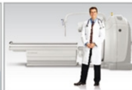
Gama Câmara Híbrida