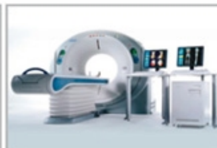
Tomógrafo Multislice 64 canais