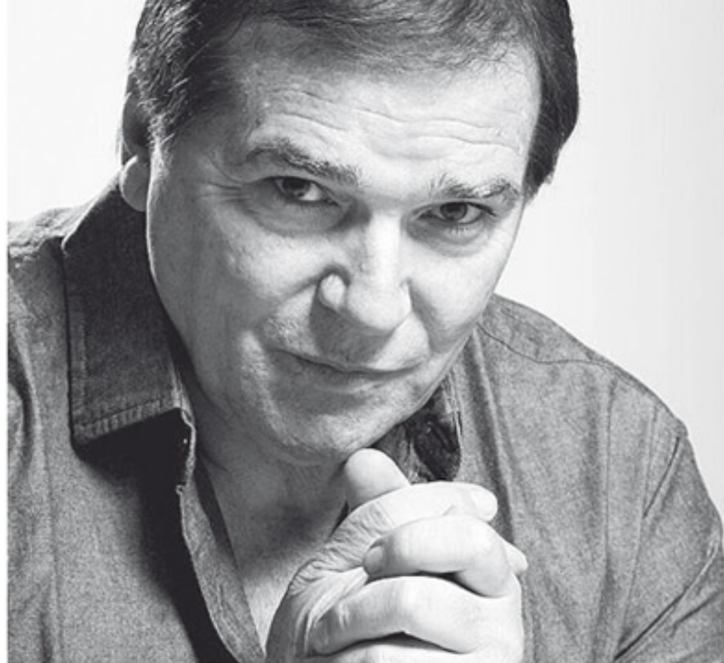
Rodrigo Meneghello / Divulgação