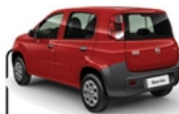
UNO 1.0 4P VIVACE 10/11 CINZA/ERU 2932/DIR.HIDRÁULICA/ VIDROS E TRAVAS ELET. R$ 18.990 , à vista ABSOLUTA ANA COSTA