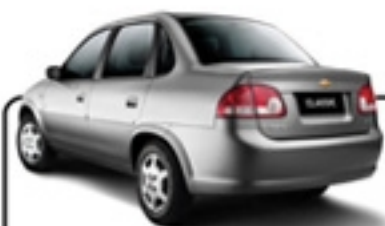
CLASSIC 1.0 4P LS 11/12 PRETA/ EVX 8100/ DIR. HIDRÁULICA R$ 19.990 , à vista ABSOLUTA PRAIA GRANDE