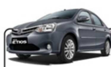
ETIOS 1.5 SEDAN XS 12/13 BRANCA/FJE5520/AIR BAG/ABS R$ 31.990 , à vista ABSOLUTA ANA COSTA