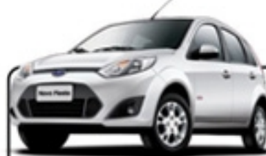
FIESTA 1.6 HATCH 10/11 VERMELHA/ERU 3173/ COMPLETO/RD R$ 22.990 , à vista ABSOLUTA SENADOR FEIJÓ