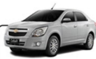
COBALT 1.4 4P LTZ 12/13 BRANCA/FBW 8656/ COMPLETO/AIR BAG II/ABS R$ 33.990 , à vista ABSOLUTA SENADOR FEIJÓ