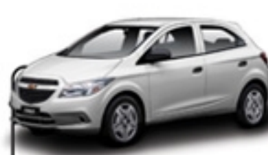
ONIX 1.0 LT13/13 VERMELHA/FJW 6687/DIR.HIDRÁULICA/ VIDROS E TRAVAS ELET/AIR BAG II/ABS R$ 28.990 , à vista ABSOLUTA PRAIA GRANDE