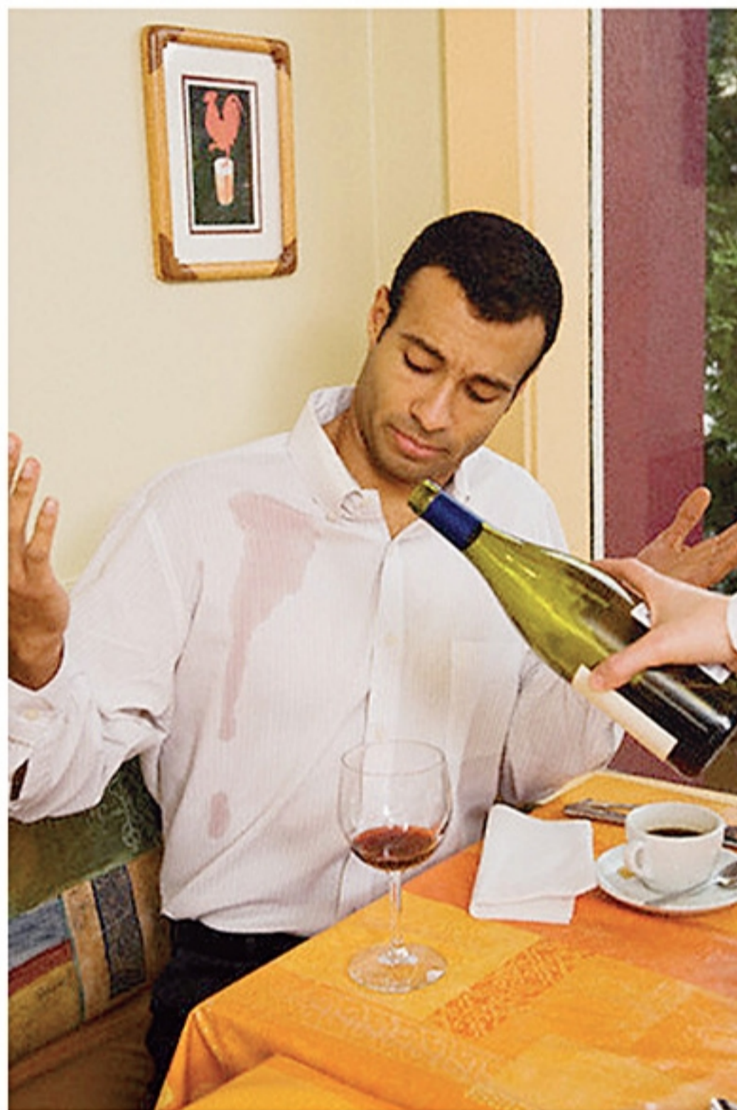
Projeto tem como objetivo qualificar os profissionais que atuam no comércio e atrair novos talentos para o setor

Não leve nada para o lado pessoal. Muitas vezes, lidando com pessoas estressadas ou mal educadas, você pode ouvir alguma coisa que te ofenda. Não leve para o lado pessoal. Se a pessoa estiver trocando algo que deu defeito, é natural que ela esteja irritada.