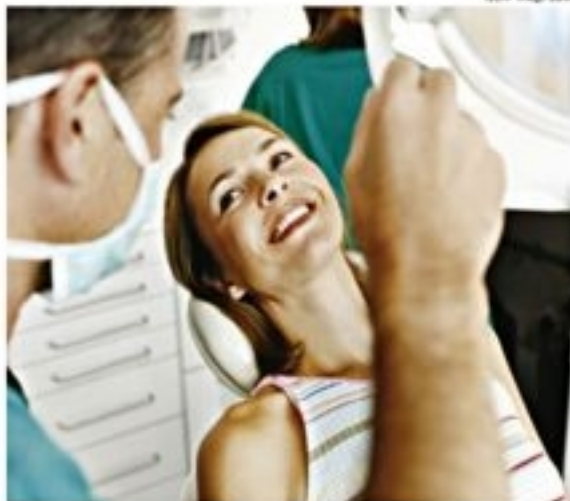
1289 Image Bank

"Na implantodontia moderna, não se aceita mais a simples colocação de dentes. As pessoas en-