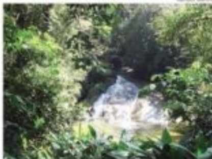
Comunidade percorre a Trilha da Ruína, na Mata Atlântica

A Cançara Expedições oferece duas opções de passeios para o último final de semana de férias. No sábado (28), o convite é para conhecer a Trilha da Ruína, na área continental de Santos, com caminhada em meio à Mata Atlântica, passando por ruínas históricas e piscina natural. No domingo (29) tem o Giro Náutico Ilha de São Vicente, roteiro náutico cuja rota passa por Cabão, São Vicente, Praia Grande, Santos e Guarujá. Reserva antecipada até quinta-feira (26) pelo e-mail contato@cançaraexpedicoes.com , tel. 3466.6909.