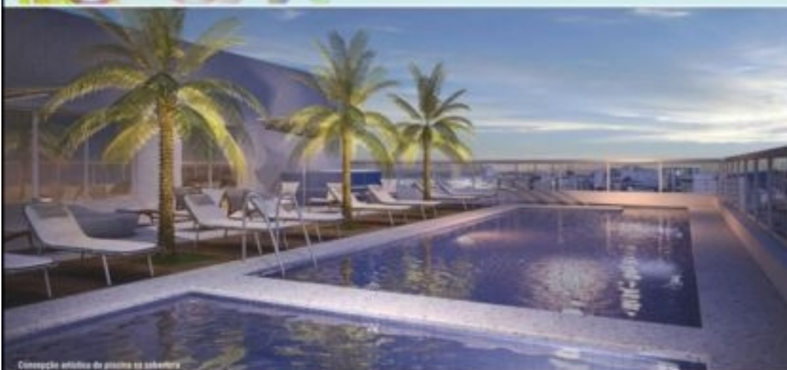
Concepção artística da piscina na cobertura