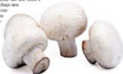
Andrey Gukhovich - Image Bank

A falta de vitamina D também está relacionada a uma série de doenças graves em crianças e adultos (como diabetes, esclerose múltipla e raquitismo), mal que provoca enfraquecimento e deformação dos ossos e pode ser prevenida com medidas simples, através da alimentação, exposição ao sol e uso de suplementos. Os primeiros sintomas da deficiência deste nutriente são dor óssea e muscular e inchaço nos punhos e nos costelas. Entre os alimentos recomendados estão os peixes oleosos, ovos e cogumelos.