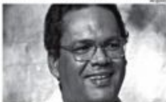
Unidade de saúde levará nome do ex-prefeito

Trata-se de uma justa homenagem a um homem que dedicou grande parte de sua vida para cuidar da saúde das pessoas, em especial das mais pobres. Para quem não sabe, enquanto secretário de Saúde de Santos, no governo Teófilo de Souza (1989 a 1992) e depois como prefeito (1993 a 1996), Capistrano revolucionou o sistema de saúde de Santos. Seu trabalho foi reconhecido internacionalmente. David Capistrano morreu em 10 de novembro de 2009, por problemas no fígado, em razão de uma lesão.