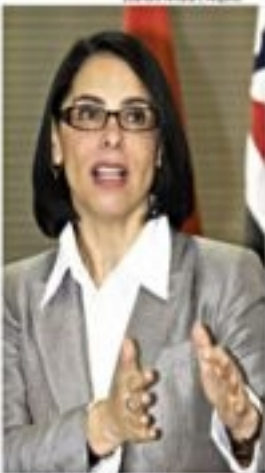
E agora, prefeita?