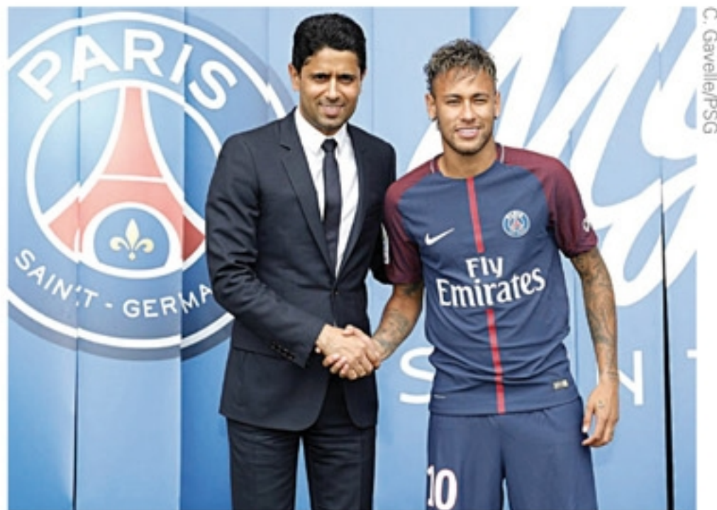
O presidente do Paris Saint-Germain, Nasser Al-Khelaifi, e o atleta contratado a peso de ouro

varo-Odílio, fez a clara opção de manter Neymar no elenco priorizando o desempenho do time nos campeonatos que disputava e não o lucro de uma venda. Teve sucesso absoluto nesse planejamento. Ganhou uma Libertadores, a de 2011. Para se ter uma ideia da dimensão dessa conquista, outros gigantes do futebol brasileiro, como Flamengo, Palmeiras e Corinthians, têm, na história toda, apenas uma conquista dessa Copa, que é a mais importante competição para clubes brasileiros. Nem o próprio Mundial de Clubes tem essa dimensão, organizado com a participação de clubes sem expres-