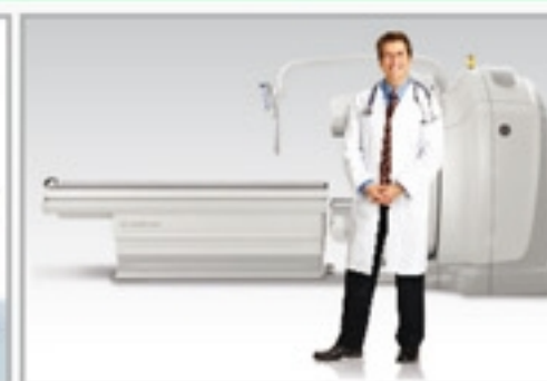
Gama Câmara Híbrida

Gerenciado pelos médicos da Unidade de Terapia Intensiva (UTI), conforme é praticado nos Estados Unidos, o Pronto-Socorro da Beneficência Portuguesa está aberto 24 horas por dia. Conta com uma equipe de profissionais capacitados e treinados no serviço de suporte emergencial. Possui equipamentos modernos e, além disso, está próximo de completa infraestrutura como Banco de Sangue, UTI e Centro Cirúrgico. No Pronto-Socorro da Beneficência, atendimento com qualidade é fundamental. Por isso, segue rígidos protocolos com padrão internacional cujo objetivo é garantir sempre o melhor atendimento para cada paciente. Afinal, cuidar bem das pessoas e valorizar a vida está em nossa origem.