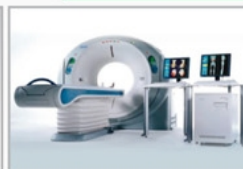
Tomógrafo Multislice 64 canais