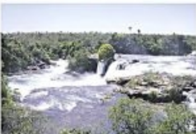
Cacheira de Velho. Uma queda d'água com 25 metros de altura e 60 metros de largura, que garante água doce nas proximidades.