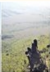
Parque Estadual Serra Onçopora com 200 metros de altura, conta-se chega até o rio por uma trilha de aproximadamente 100 metros. Com 10 de longo, forma uma vista privilegiada de toda a paisagem, com as montanhas e o rio à sua volta.