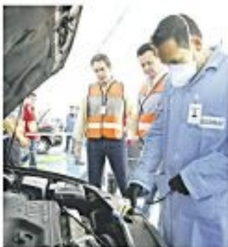
No município de São Paulo, inspeção ambiental em todos os automóveis de passeio e obrigatória desde 2010.

Essa operação que visa a reduzir as emissões de gases de efeito estufa para inspecionar veículos em todo o município de São Paulo, inspeção ambiental em todos os automóveis de passeio e obrigatória desde 2010.