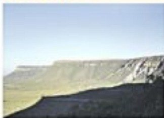
Parque Estadual Serra Onçopora com 200 metros de altura, conta-se chega até o rio por uma trilha de aproximadamente 100 metros. Com 10 de longo, forma uma vista privilegiada de toda a paisagem, com as montanhas e o rio à sua volta.