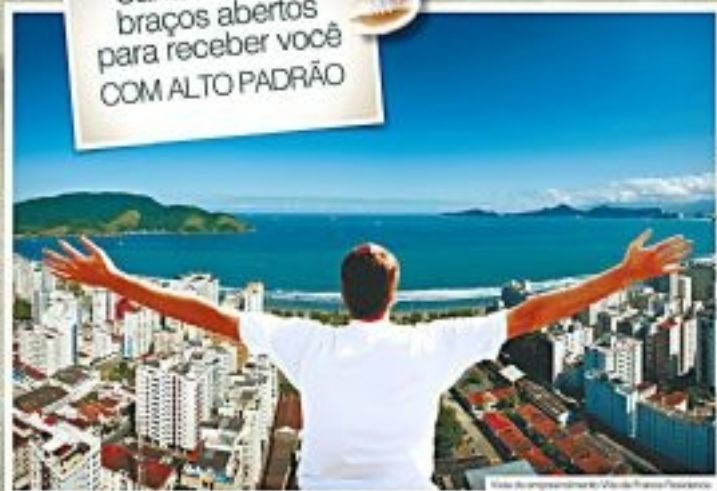
Vista do empreendimento Ville de France Residence

Santos está de braços abertos para receber você COM ALTO PADRÃO