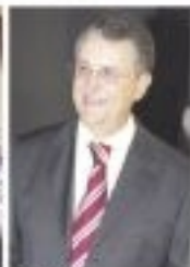
Presidente da Fundação de Amparo à Pesquisa do Estado de São Paulo (FAPESP), Luiz Carlos de Carvalho.