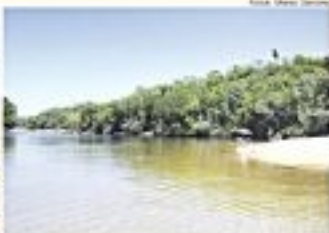
Parque Estadual Serra Onçopora com 200 metros de altura, conta-se chega até o rio por uma trilha de aproximadamente 100 metros. Com 10 de longo, forma uma vista privilegiada de toda a paisagem, com as montanhas e o rio à sua volta.

Capim Secado O Jaleco é o produto mais importante do artesanato brasileiro. Possuindo um caráter histórico, o jaleco é um produto de origem indígena, sendo utilizado para a proteção do corpo. Com a chegada do jaleco, os índios passaram a utilizar o jaleco para a proteção do corpo. Com a chegada do jaleco, os índios passaram a utilizar o jaleco para a proteção do corpo. Com a chegada do jaleco, os índios passaram a utilizar o jaleco para a proteção do corpo.