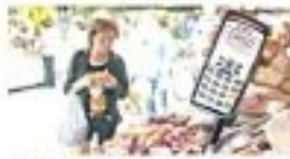
Qualidade, preço baixo, praticidade...

Qualidade, preço baixo, praticidade... Essas são algumas das vantagens das feiras livres. Além disso, elas também oferecem um espaço de encontro e troca. Muitas feiras também oferecem produtos orgânicos e artesanais, que são muito valorizados pelos consumidores.