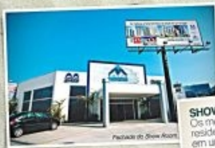
Fachada do Show Room

Vá ao Show Room e conheça empreendimentos concluídos, para mudar já, ou aproveite os nossos lançamentos em obras.