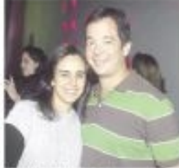
Aluno e Aluna do curso de graduação em Administração de Empresas, FGV.