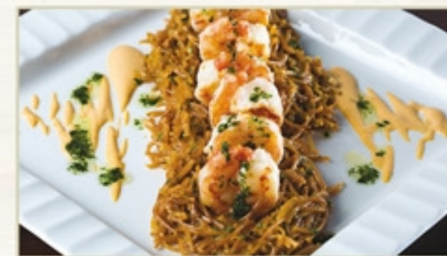
Restaurante Elo Gastronomia Santos - Gonzaga Fideuá de Camarão