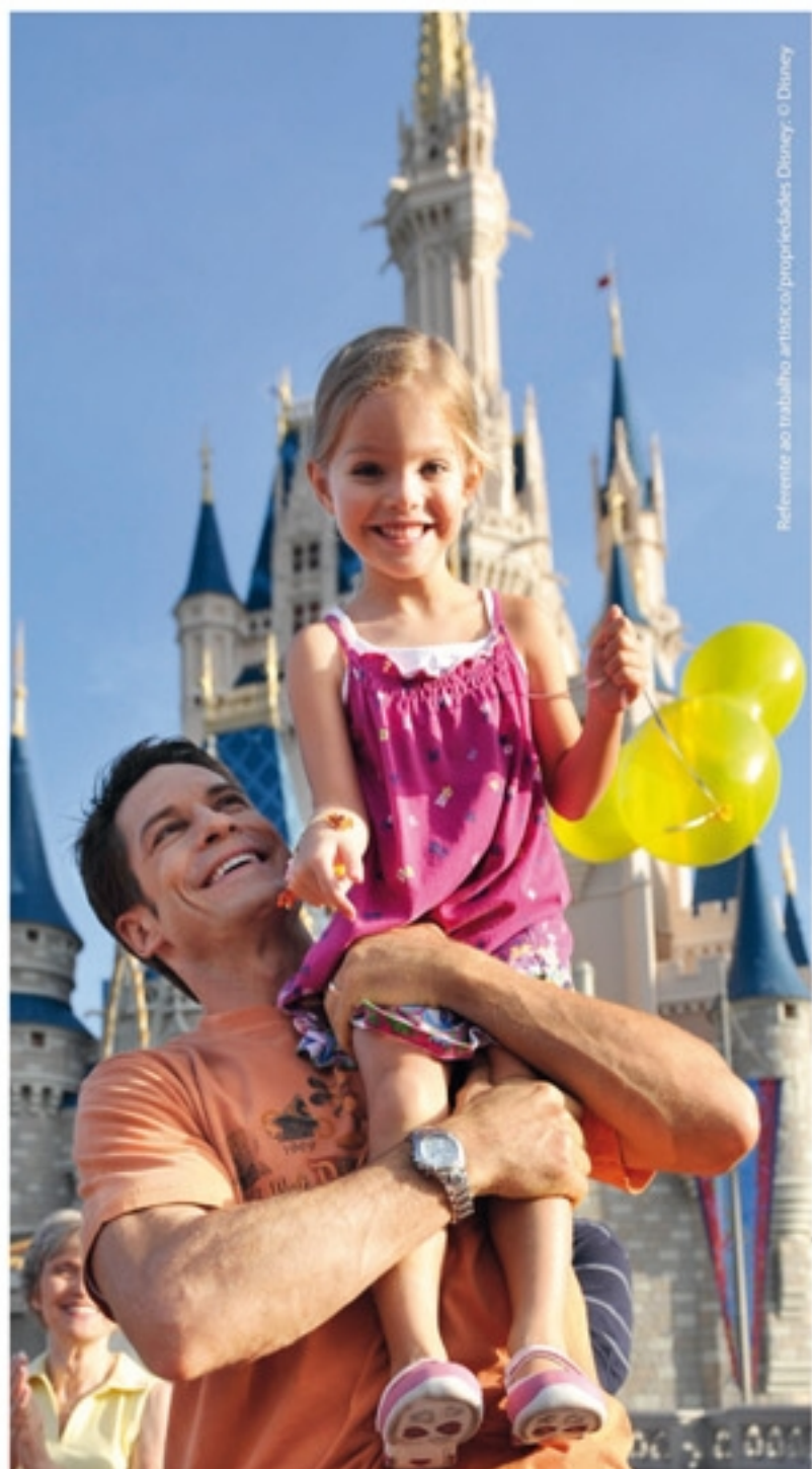
Referente ao trabalho artístico: propriedades Disney. © Disney