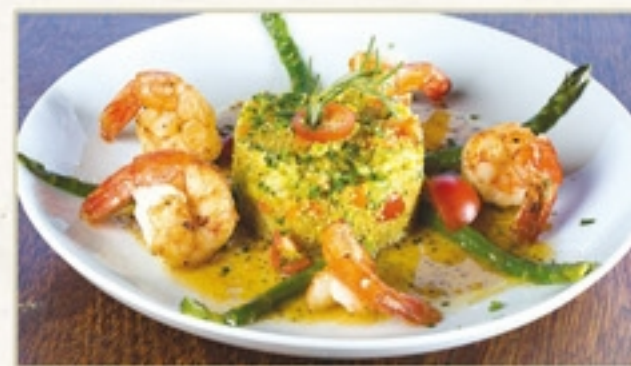
Restaurante Chapéu de Sol Juquehy - São Sebastião Camarão Quinoa