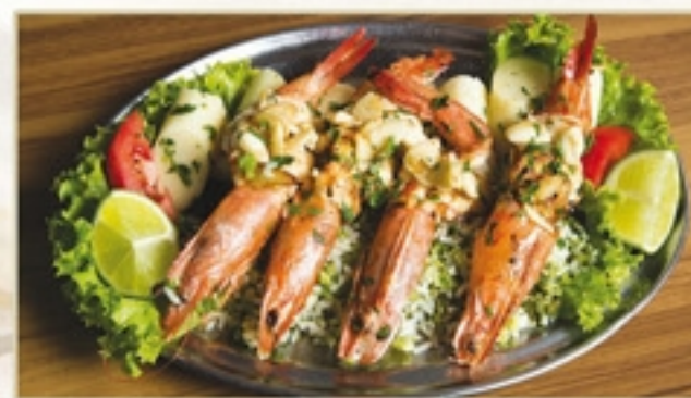
Restaurante Chopp Halle Guarujá - Pitangueiras Camarão ao alho laminado

Camarão com garantia de procedência servido nos melhores hotéis e restaurantes da região.