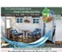
Projeto: [unreadable]. Rua [unreadable], [unreadable].

Para quem deseja conhecer a cidade e aproveitar a natureza, o Parque do Sol é a melhor opção. O parque oferece trilhas para caminhada, ciclismo e equitação. Além disso, há várias opções de recreação para toda a família.