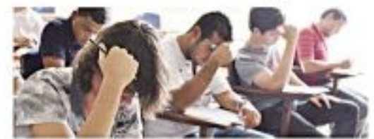
Polícia Militar, que é o maior e a principal força policial do Brasil, Santos

A sociedade brasileira não está pronta para enfrentar a crise econômica que se avizinha. A população brasileira não está pronta para enfrentar a crise econômica que se avizinha.