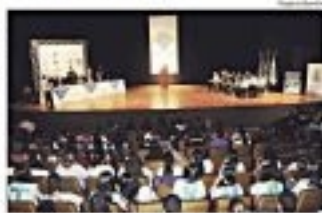
Estudantes participaram de um debate e ele simulado no Jovem Eleitor do JUV Eleitoral, Governo Municipal de Curitiba. O objetivo do sistema é a participação dos jovens na política.