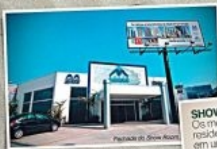
Fachada do Show Room

Vá ao Show Room e confira empreendimentos concluídos, para mudar já, ou aproveite os nossos lançamentos em obras.