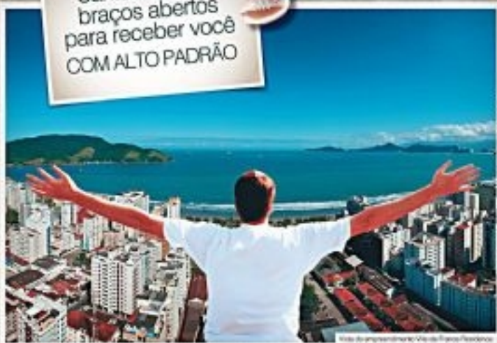
Vista do empreendimento Vila de France Residence

Santos está de braços abertos para receber você COM ALTO PADRÃO