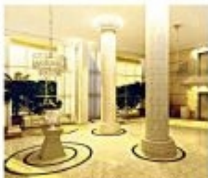
Imagem de registro que ilustra o trabalho da empresa em projetos de interiores e grandes salas de estar.

P ara a maioria dos projetos, o cliente quer beleza e solidez. O desafio é oferecer uma solução a partir da beleza. Por isso, quem quer se sentir bem em casa precisa de um ambiente que seja bonito, confortável e funcional. A solução é uma combinação de beleza e solidez. Isso é o que a empresa oferece. A beleza é dada pela decoração e a solidez é dada pela estrutura. A empresa oferece uma solução que seja bonita e sólida. Isso é o que a empresa oferece.