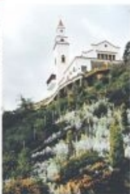
Por: [unreadable] e [unreadable].

Em comemoração aos 150 anos de fundação, o jornal lançou uma campanha de arrecadação de fundos para a construção de uma escola em Anápolis. A campanha é coordenada pelo Conselho Municipal de Educação e pelo Conselho Municipal de Cultura. O objetivo é arrecadar R$ 10 milhões para a construção de uma escola de ensino fundamental em Anápolis.