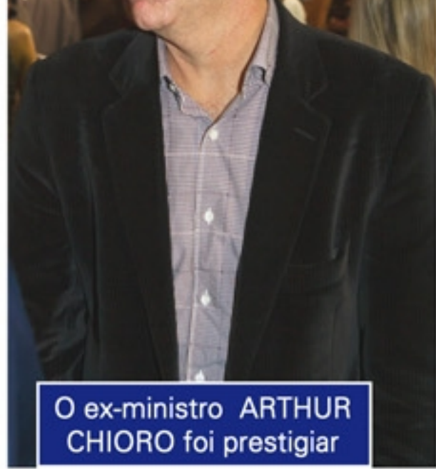
O ex-ministro ARTHUR CHIORO foi prestigiar