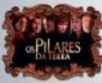
OS PILARES DA TERRA