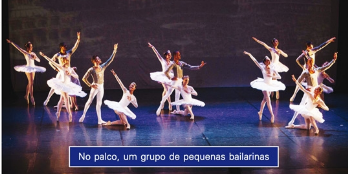
No palco, um grupo de pequenas bailarinas

Foi o espetáculo anual de ballet e jazz da Academia ContraPasso no Teatro Municipal... Muita graça e belas coreografias marcaram a apresentação