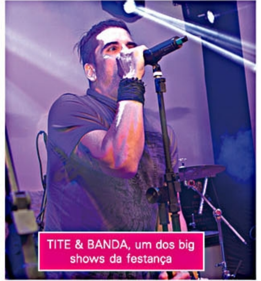
TITE & BANDA, um dos big shows da festança