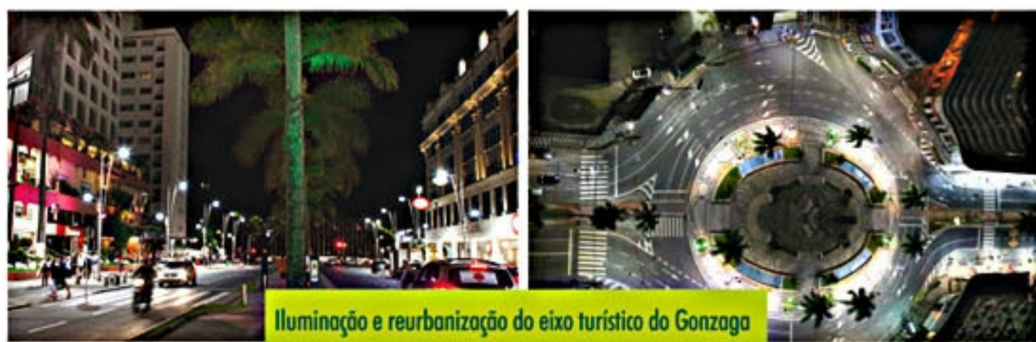
Iluminação e reurbanização do eixo turístico do Gonzaga

A Fortnort trabalha para o bem-estar de brasileiros e brasileiras. Para o seu bem-estar.