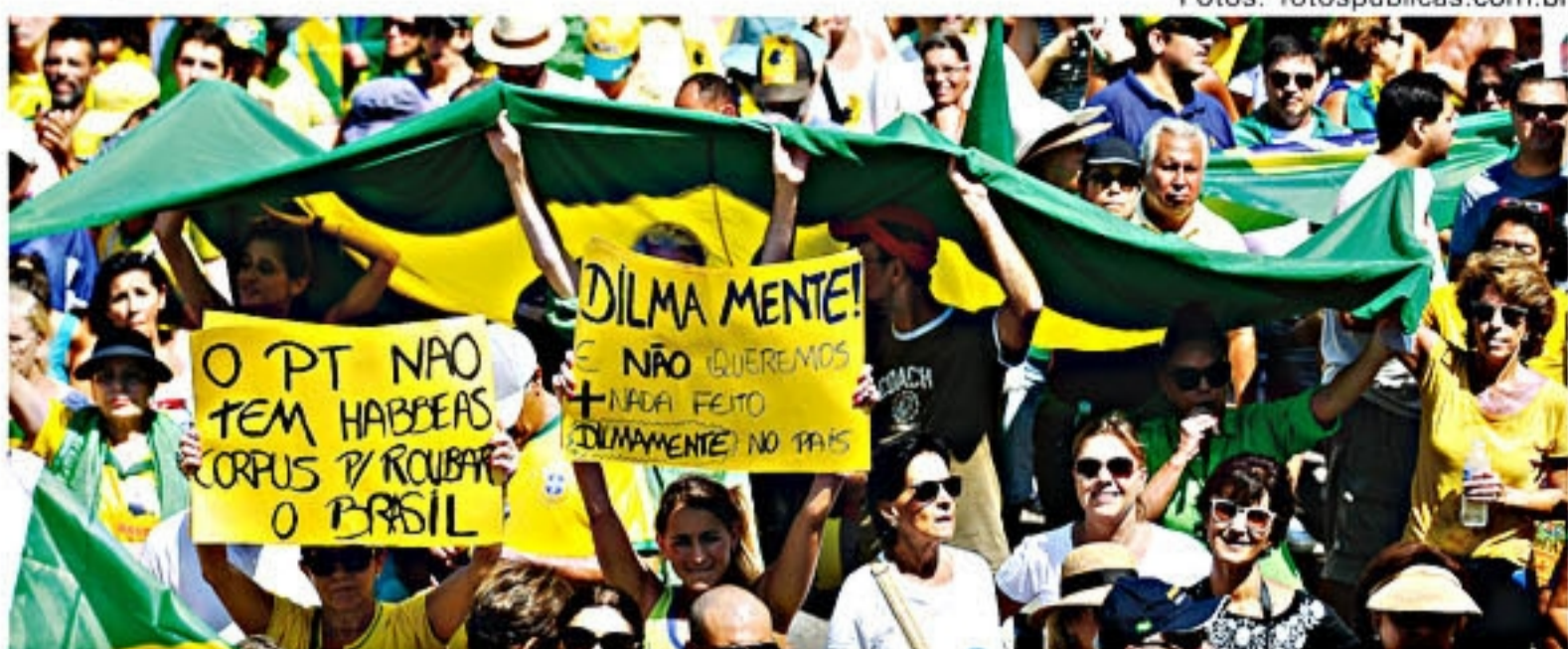
Novas manifestações pelo impeachment de Dilma