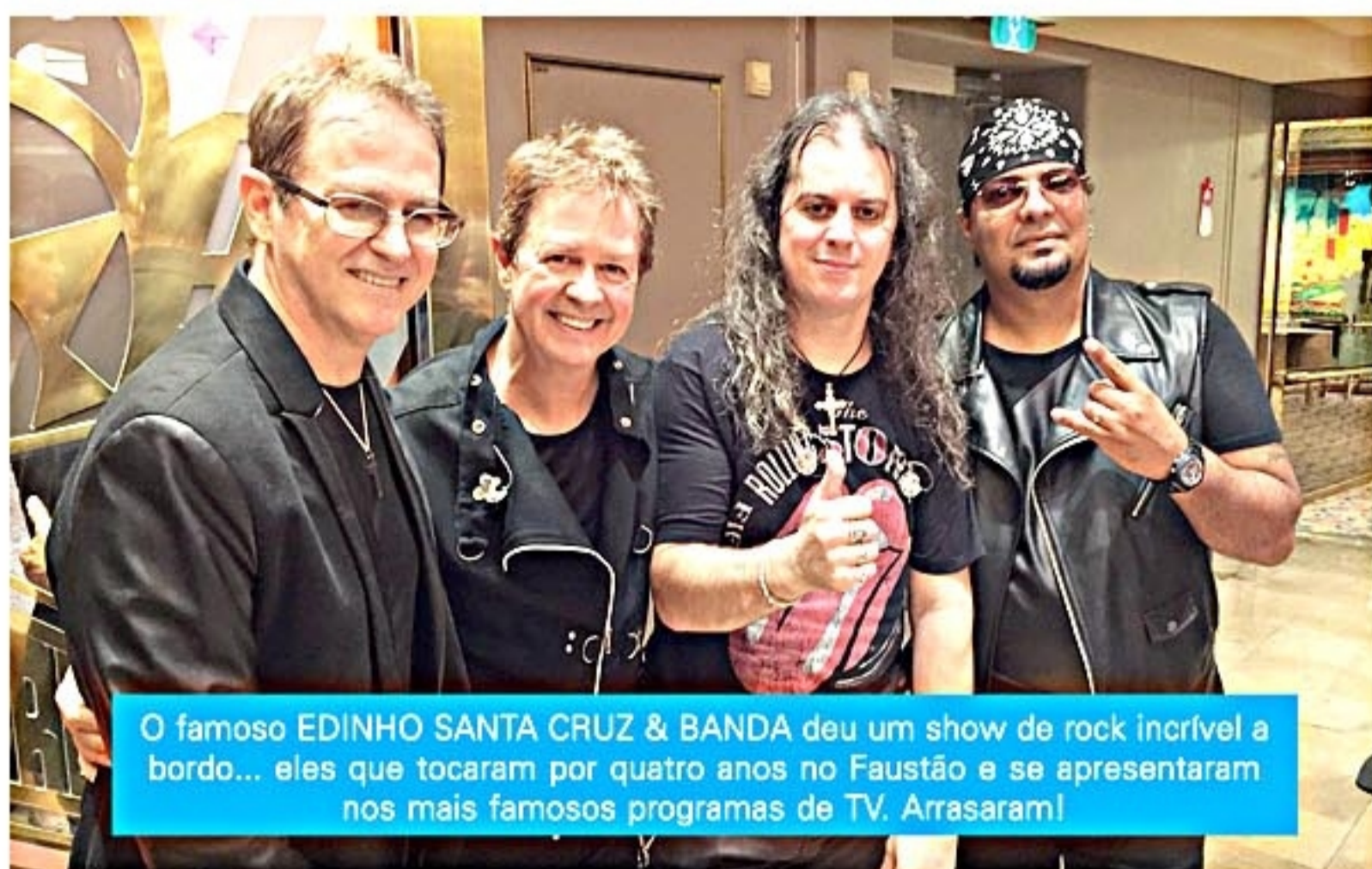
O famoso EDINHO SANTA CRUZ & BANDA deu um show de rock incrível a bordo... eles que tocaram por quatro anos no Faustão e se apresentaram nos mais famosos programas de TV. Arrasaram!