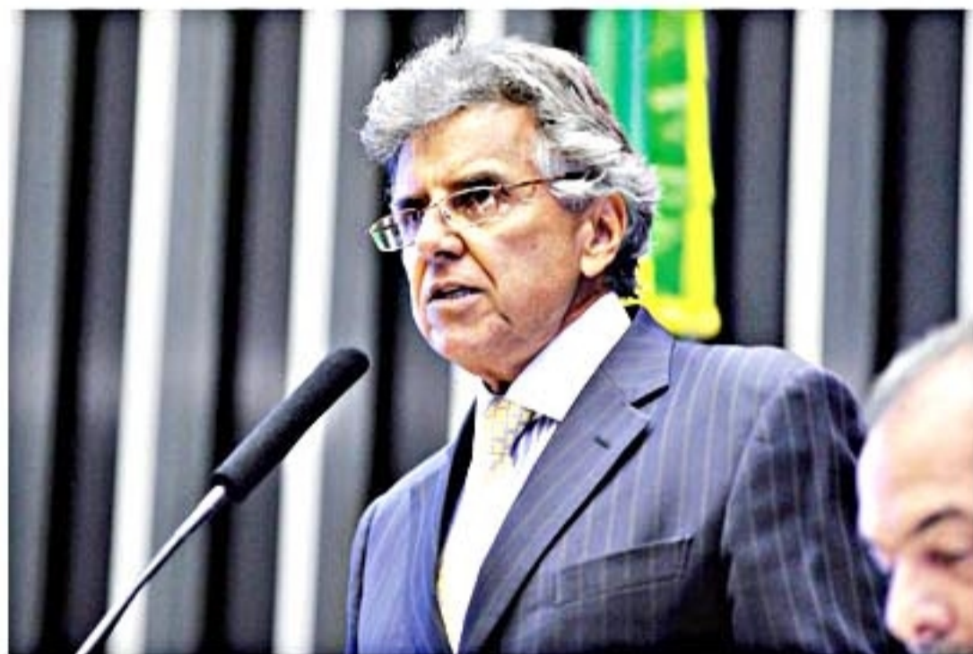
Beto Mansur defende construção do novo anexo, que inclui Shopping Center

Segundo Mansur, o espaço oferecido aos parlamentares é muito acanhado e o estacionamento é insuficiente para atender à demanda. O novo espaço, defende o parlamentar, vai garantir melhores condições de trabalho e mais comodidade não apenas para os deputados, mas, também, para representantes de todos os setores da sociedade.