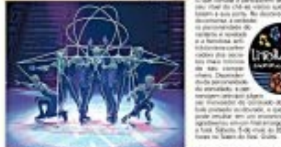
Os atores em uma cena do espetáculo "Saudade FM".

Musical - O Rei do Castelo, com direção de Roberto de Sá, estreia em Curitiba no dia 15 de maio, às 20h, no Teatro Colibú. O espetáculo é uma adaptação do musical infantil "O Rei do Castelo", escrito por Roberto de Sá e baseado no livro de Roberto de Sá, "O Rei do Castelo".