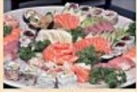
Um prato do temaki do Japão, com o uso de ingredientes locais. O temaki é um prato japonês que consiste em enrolar uma folha de alga com um recheio de carne, vegetais e frutos do mar.

Apesar de o conceito original japonês ser muito mais simples, o temaki ganhou um toque brasileiro com o uso de ingredientes locais. O temaki é um prato japonês que consiste em enrolar uma folha de alga com um recheio de carne, vegetais e frutos do mar. O temaki é um prato japonês que consiste em enrolar uma folha de alga com um recheio de carne, vegetais e frutos do mar.