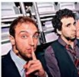
Marcelo Machado em um dos seus programas de TV.

Como Marcelo Machado sabe que os seus programas são de alta qualidade, ele sabe que ele é um dos melhores apresentadores de TV do Brasil. Isso não é tudo, mas é o suficiente para que ele seja considerado um dos melhores apresentadores de TV do Brasil.