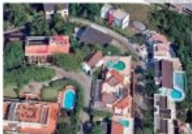
Um dos pontos de ocupação de áreas de risco no Alto do Morro.

O prefeito afirma que o município não tem condições de lidar com a ocupação de áreas de risco. Ele afirma que o município não tem condições de lidar com a ocupação de áreas de risco.