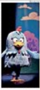
O personagem principal do musical infantil "A Galinha Pintadinha".

Os Paisanos - Um grupo de teatro apresenta o espetáculo "Os Paisanos" no dia 15 de maio, às 20h, no Teatro Colibú. O espetáculo é uma adaptação do musical infantil "Os Paisanos", escrito por Roberto de Sá e baseado no livro de Roberto de Sá, "Os Paisanos".