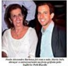
Paula Alexandra Barbosa e o marido.