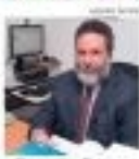
O prefeito Denis de Paula Junior.

O prefeito afirma que o município não tem condições de lidar com a ocupação de áreas de risco. Ele afirma que o município não tem condições de lidar com a ocupação de áreas de risco.