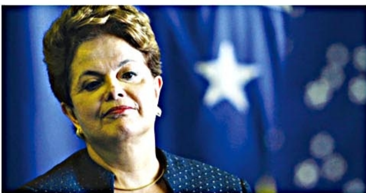
Dilma: 55,4% reprovam e 20,4% aprovam