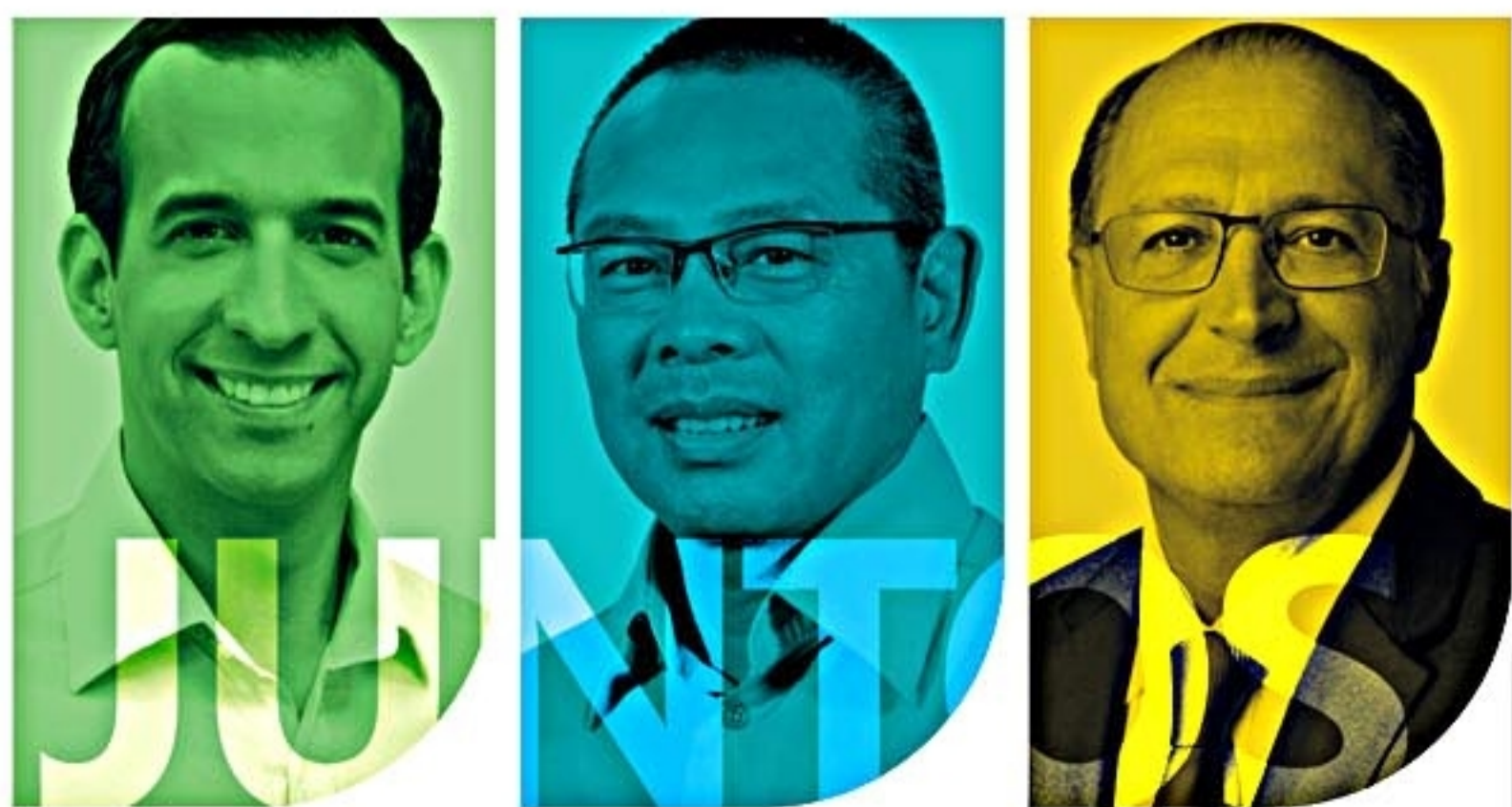
GERALDO ALCKMIN 45 GOVERNADOR