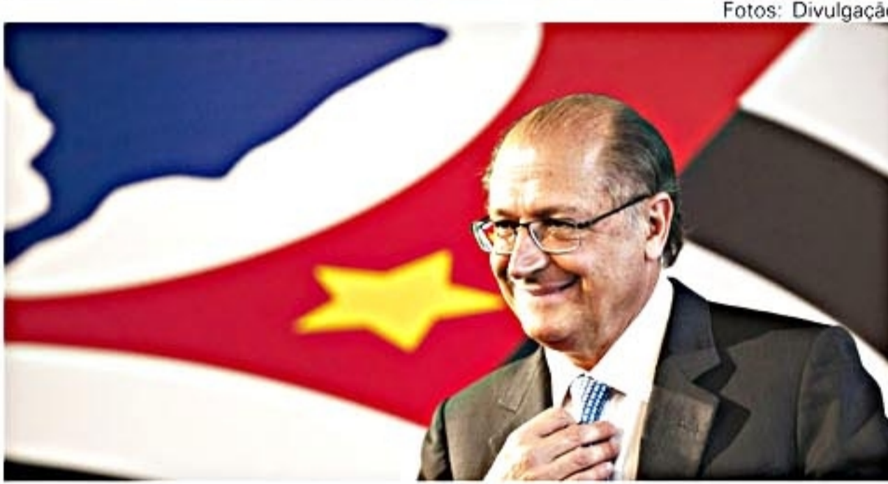
Alckmin: 50% aprovam e 18,5% reprovam