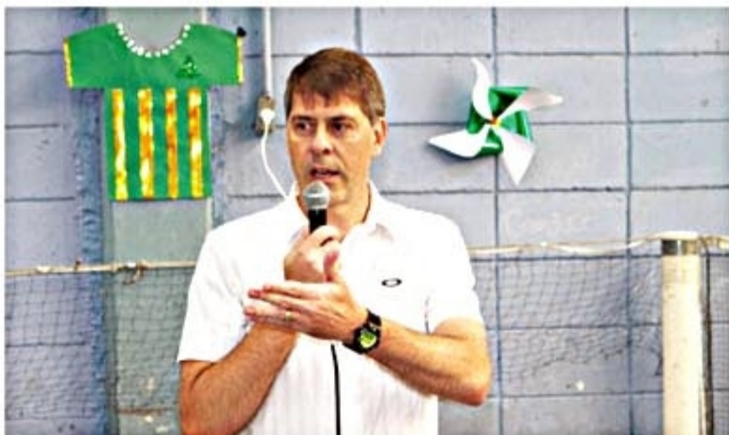
Cidão: estímulo ao esporte é fundamental