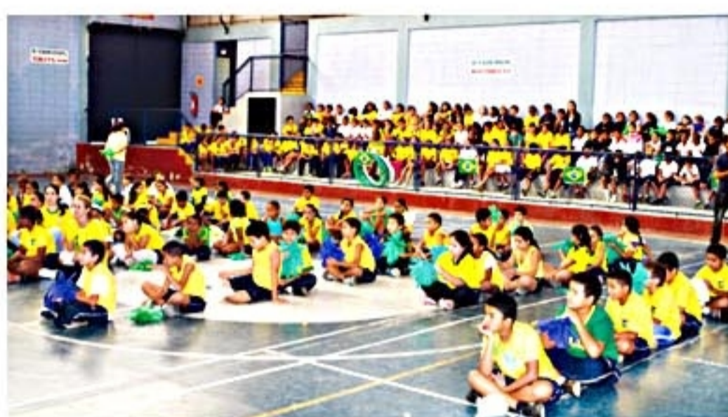
Na abertura desta etapa do Projeto Cidadão, alunos exibiram coreografias inspiradas na Copa do Mundo