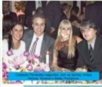
Os convidados em uma noite de festa de Badalando, celebrando a noite de casamento e o início de uma vida a dois.