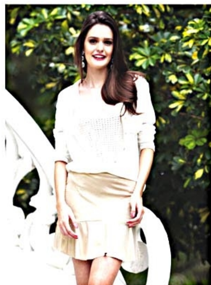
O dourado é uma opção para deixar o visual mais sofisticado

AGRADECIMENTO: Conceito Iriana, Le Lis Blanc, Pinacoteca Benedicto Calixto, agência de modelos By Cló (3223-8885)