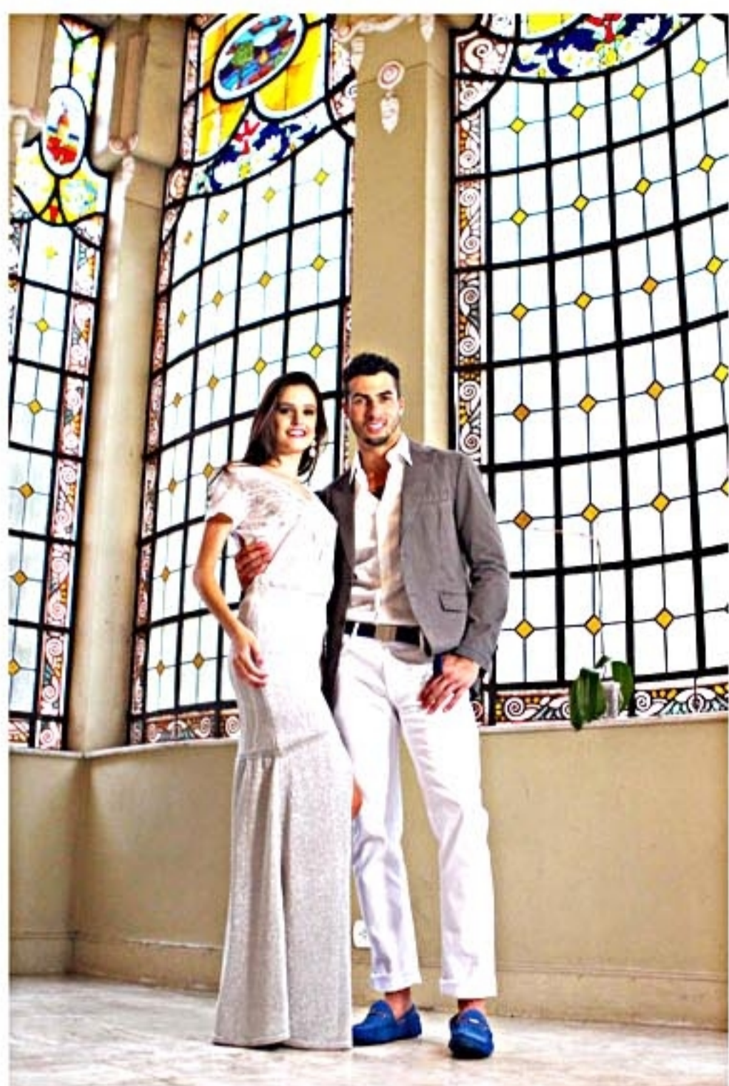
Para um ambiente requintado, como um hotel ou restaurante, o ideal é optar por uma roupa um pouco mais formal

A virada do ano é, sem dúvida, a data mais comemorada em todo o mundo. Uma época em que todos querem renovar as energias e seus votos de esperança. E por que não começar o ano com uma roupa nova? O branco já é tradicional, mas não é uma regra. A moda é democrática e as cores podem ser usadas como forma de atrair amor, riqueza, paz e prosperidade no ano que está chegando. Mas, de um tempo pra cá, o dourado e o prata vieram para dar mais sofisticação ao look.