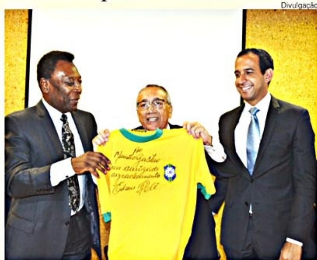
Na reunião em Brasília, ministro do Turismo recebeu uma camisa autografada por Pelé

Se o Museu Pelé não ficar pronto até a Copa do Mundo, a cidade vai pagar um grande mico e alguém terá de dar explicações convincentes à opinião pública.