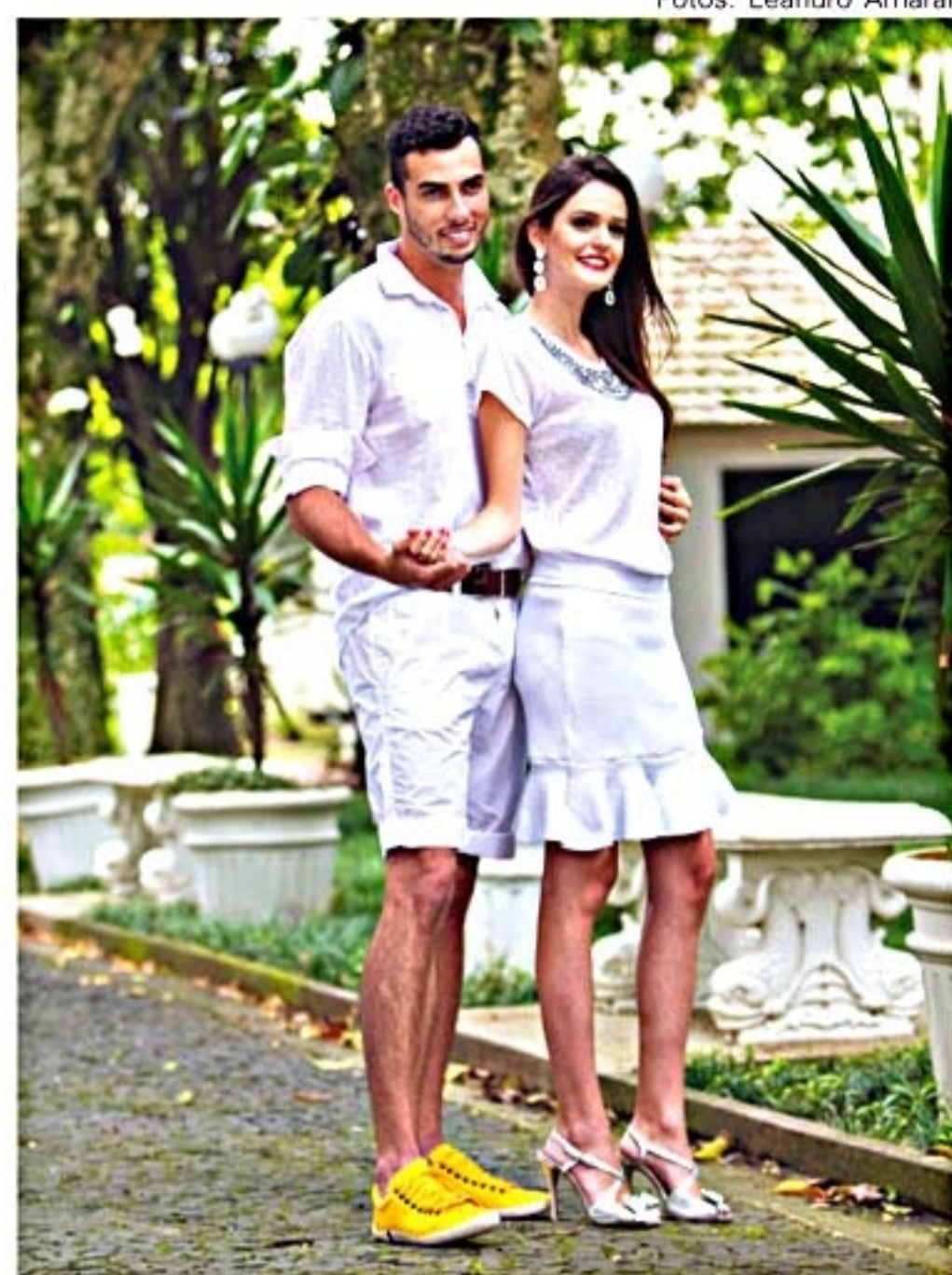
Para o visual masculino, um toque de cor no look quebra o "branco total"; no feminino, saia até o joelho com babado para uma festa informal