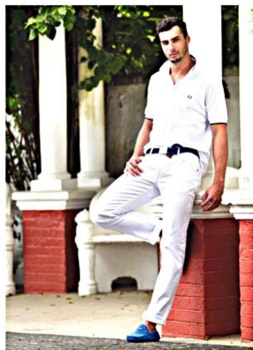
Uma calça de alfaiataria com uma polo deixa o visual mais descontraído e bastante elegante