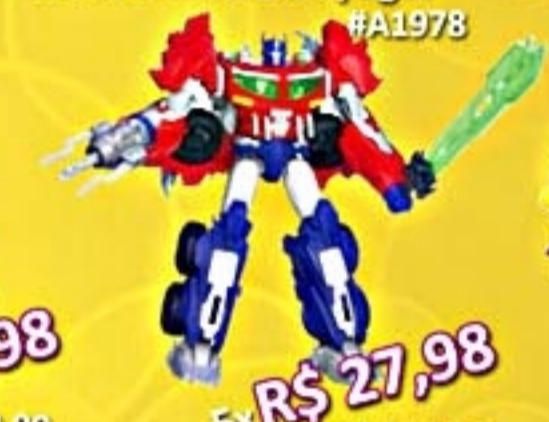
Transformers Voyager #A1978