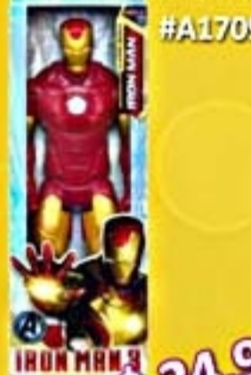
Homem de Ferro #A1709