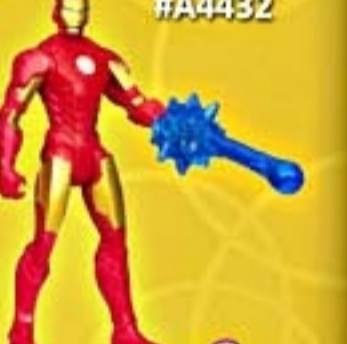
Bonecos Avengers 3.75" All Stars #A4432