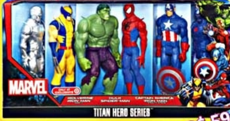
Marvel Universe Com 6 Bonecos de 12" #A4971