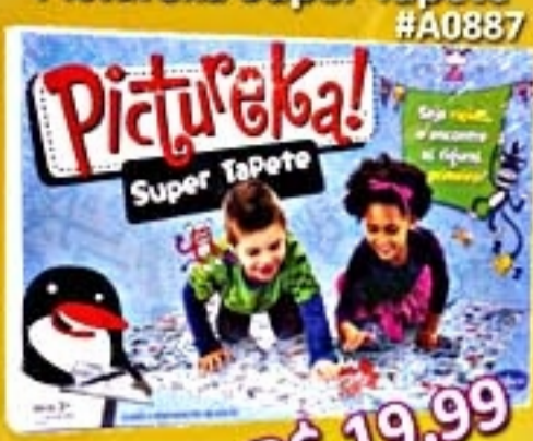
Pictureka Super Tapete #A0887