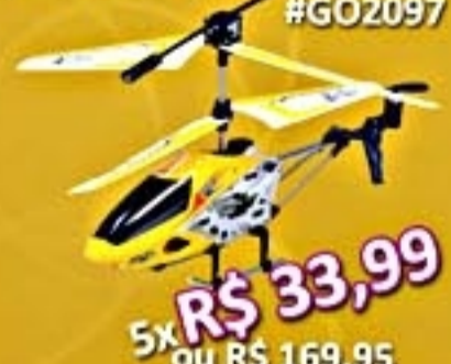
R/C Storm Helicóptero #G02097