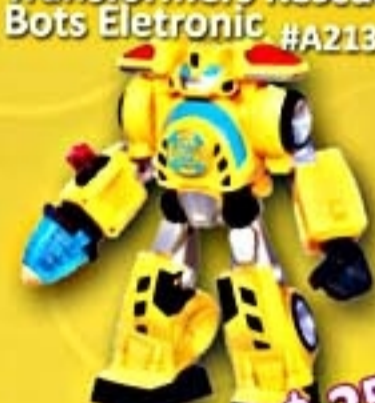
Transformers Rescue Bots Eletronic #A2137