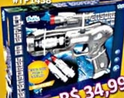
Defensor do Espaço #TP1438