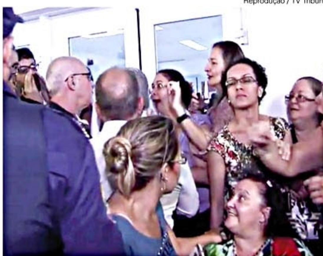
Em meio aos protestos, a sessão foi suspensa