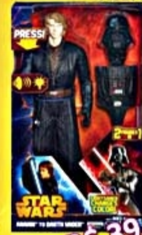
Boneco StarWars Anakin To Vader #A2177