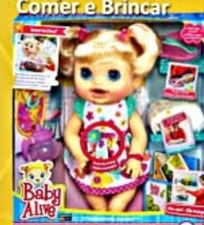
Baby Alive Comer e Brincar #A3684