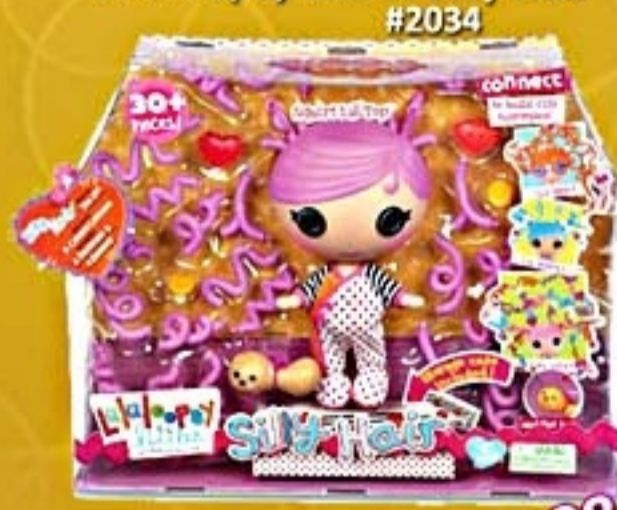
Lalaloopsy Littles Silly Hair #2034