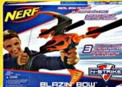
NERF El Blazin Bow #A5472