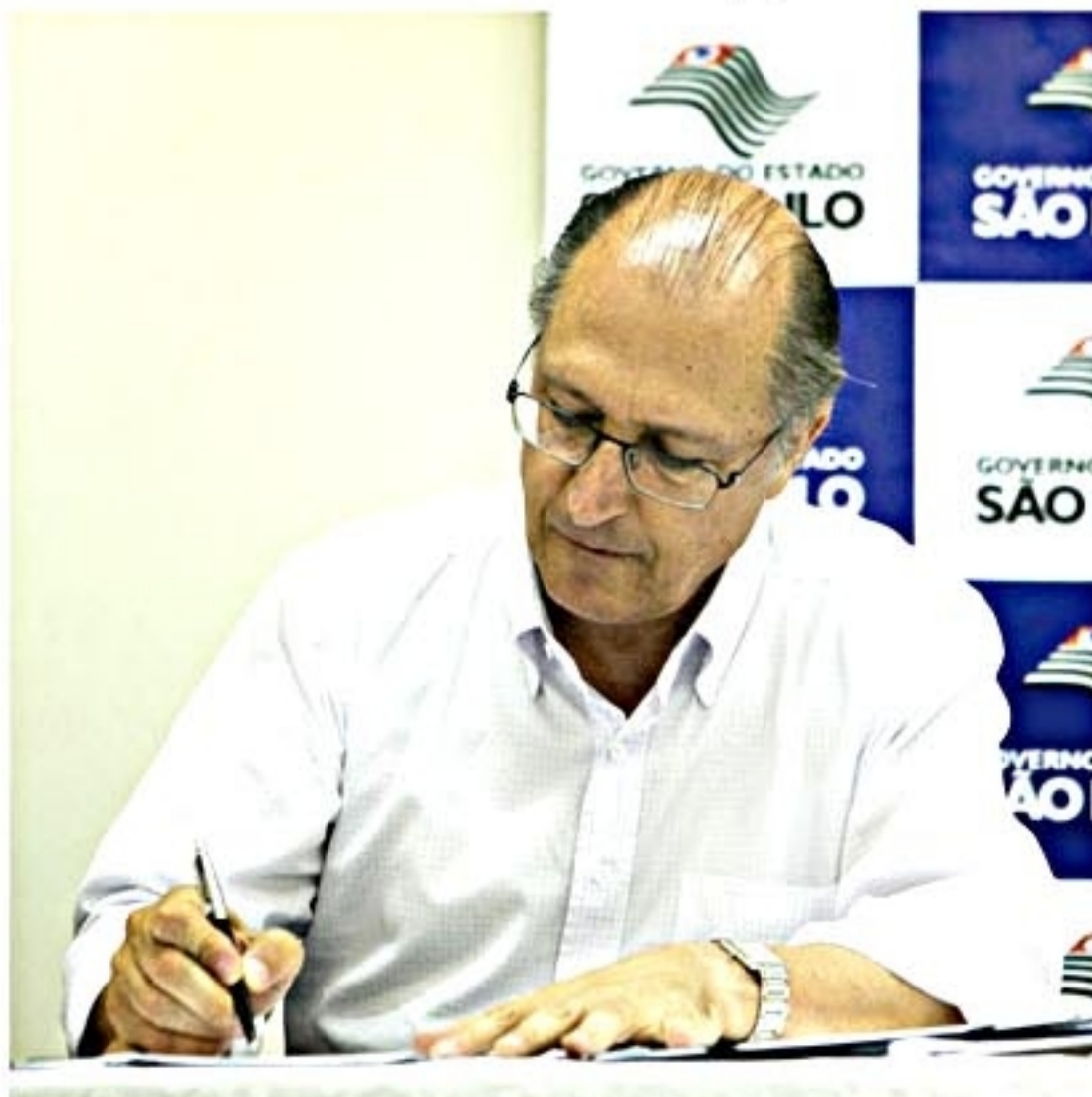
Rios voltaram a ter vida e o Projeto Tietê já reduziu a poluição em mais de 160 km. Parabéns à família sabespiana e aos paulistas, afinal a Sabesp é patrimônio de todos.

O índice da mortalidade infantil caiu 62% em 20 anos, o que diz muito dos avanços no saneamento. A sensibilidade socioambiental também está presente em programas como o Onda Limpa, a maior ação de saneamento do litoral brasileiro. Com o Se Liga na Rede, estamos conectando gratuitamente as casas de 192 mil famílias às tubulações de esgoto.