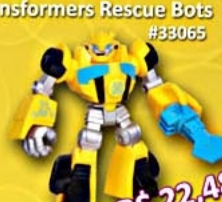
Transformers Rescue Bots #33065