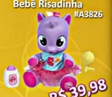
My Little Pony Bebê Risadinha #A3826