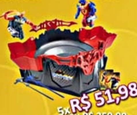
Pião e Arena Beywarriors Showdown #A2459