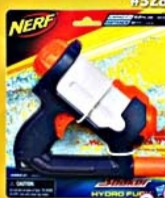
NERF Soro Fury #32854