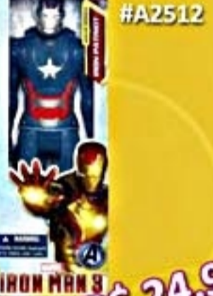
Patriôta de Ferro #A2512