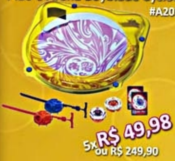
Pião e Arena Beyblade Cyclone #A2035