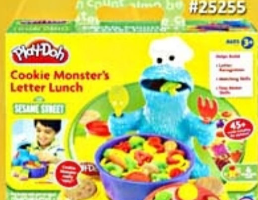
Play-Doh Vila Sésamo Come-come #25255