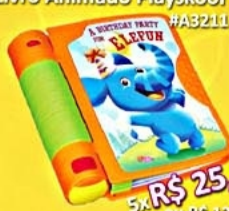
Livro Animado Playskool #A3211