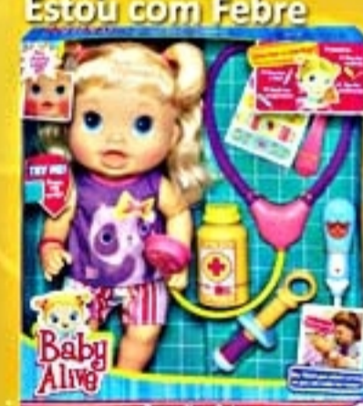
Baby Alive Estou com Febre #A3978