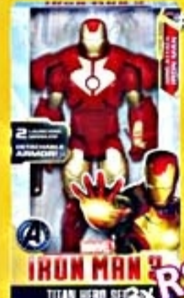
Boneco Iron Man 3 #A2513