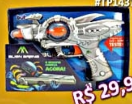
Super Defensor do Espaço #TP1437