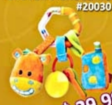
Chaveiro Chocalho #20030