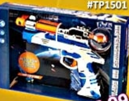
Defensor do Espaço #TP1501