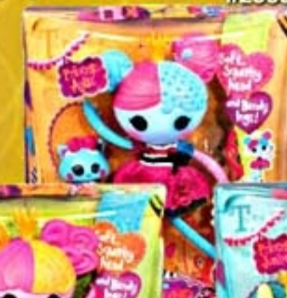
Lalaloopsy Princess #2061