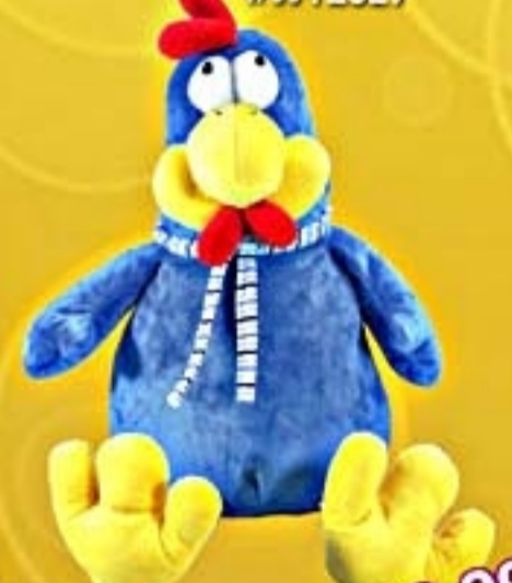
Galinha Nha #WT2027