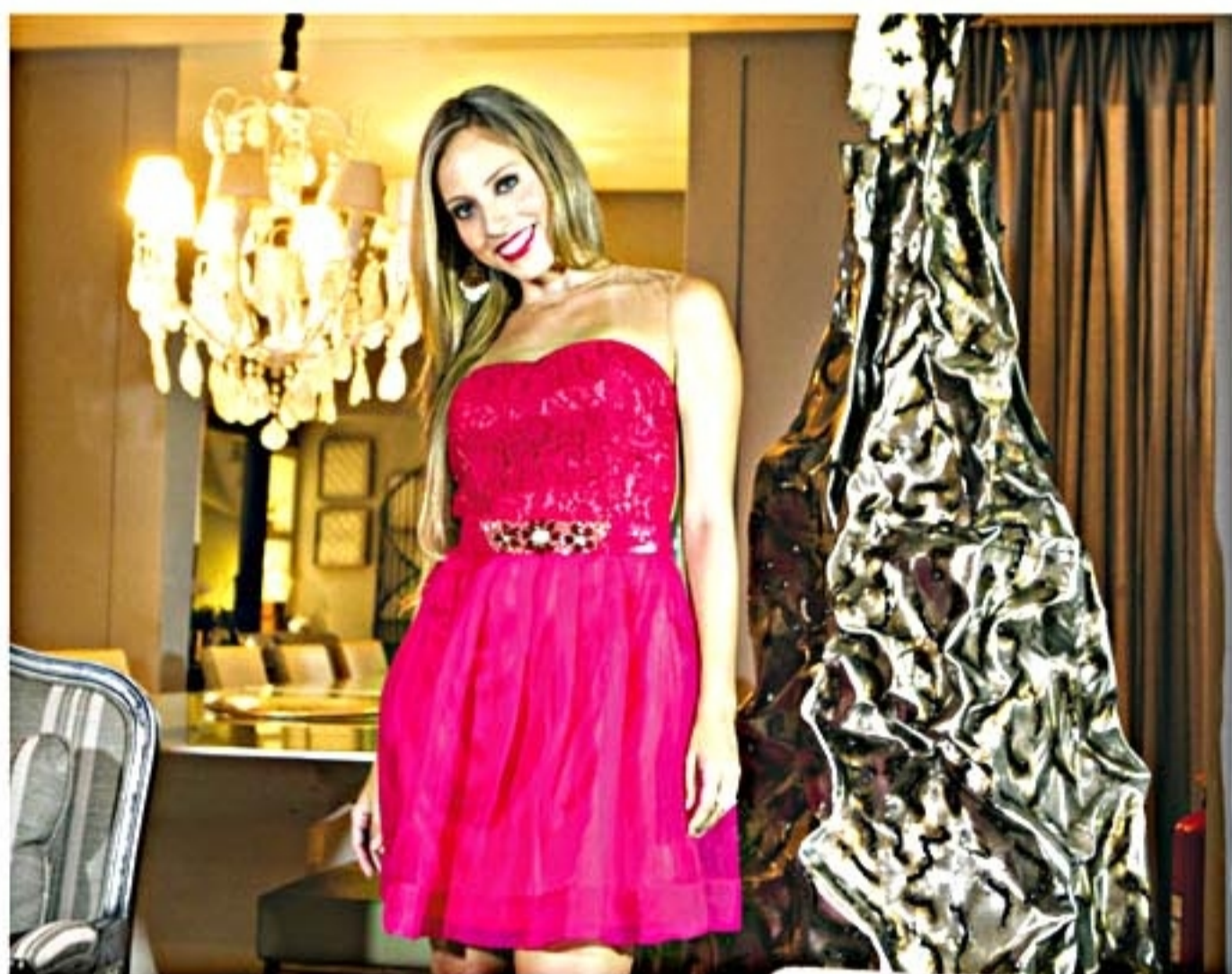
Tomara que caia com tule e saia ampla, última tendência das passarelas