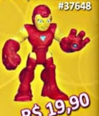
Marvel SuperHero Mini #37648