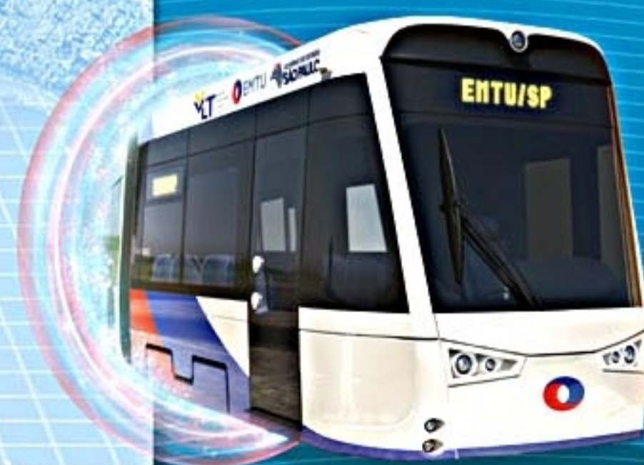
O futuro está chegando com o VLT.

Quanto mais você sabe, mais valor você dá.