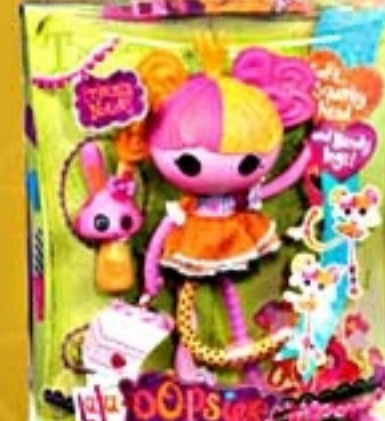
Lalaloopsy Princess #2062