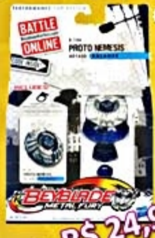
Beyblade Top System #19495