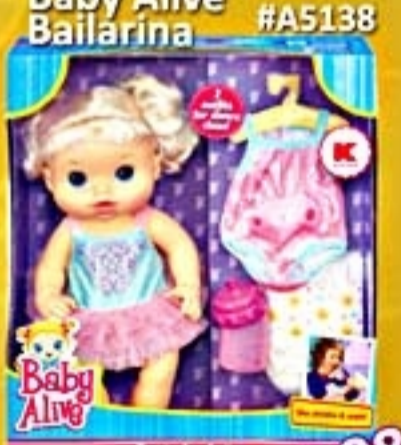
Baby Alive Bailarina #A5138