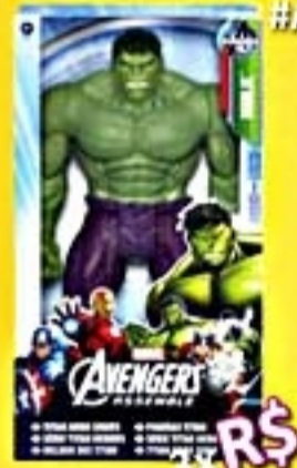
Boneco Hulk #A4810