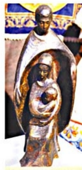
Presépio em exposição no Santuário do Valongo Santos até dia 26/1)