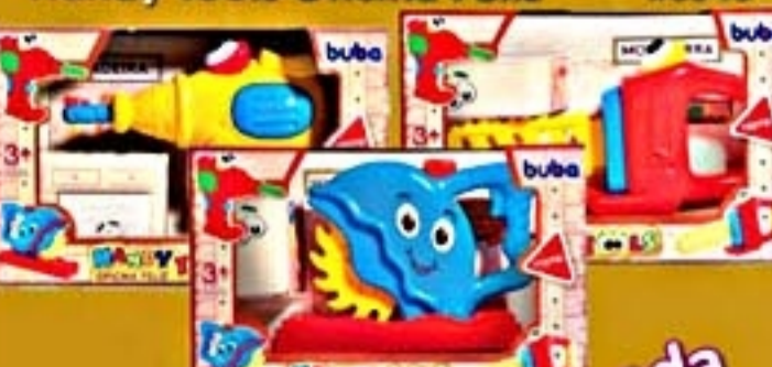
Handy Tools Oficina Feliz #0946