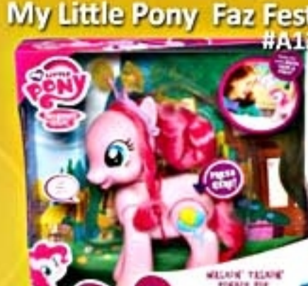
My Little Pony Faz Festa #A1384