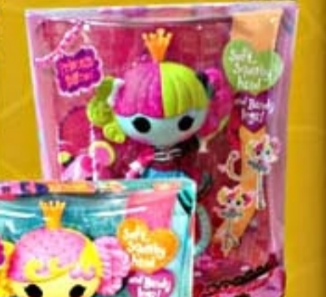
Lalaloopsy Princess #2062