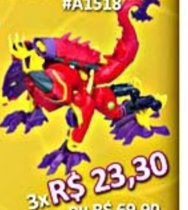
Transformers Deluxe #A1518