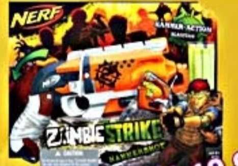
NERF Zombie Hammer #A4726