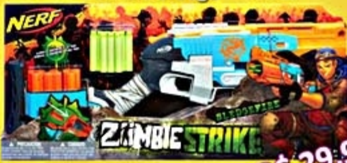
NERF Zombie Sledge #A4727