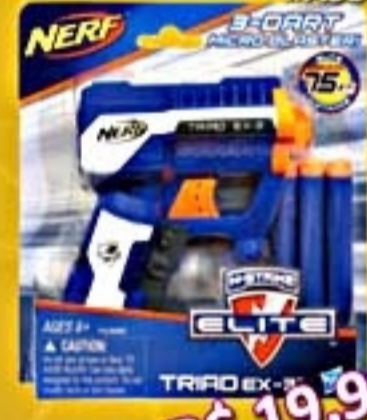
NERF Elite Triad #A3845