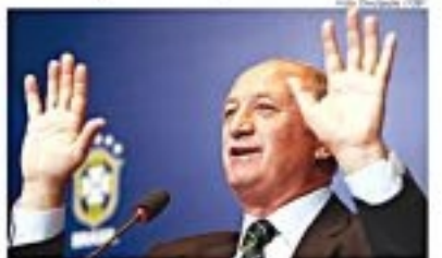
COMO SEMPRE, BASE É SOLUÇÃO

Os testes são duplos: técnico e político. O teste técnico é o jogo em si, o teste político é o que acontece em torno dele. O teste técnico é o jogo em si, o teste político é o que acontece em torno dele.