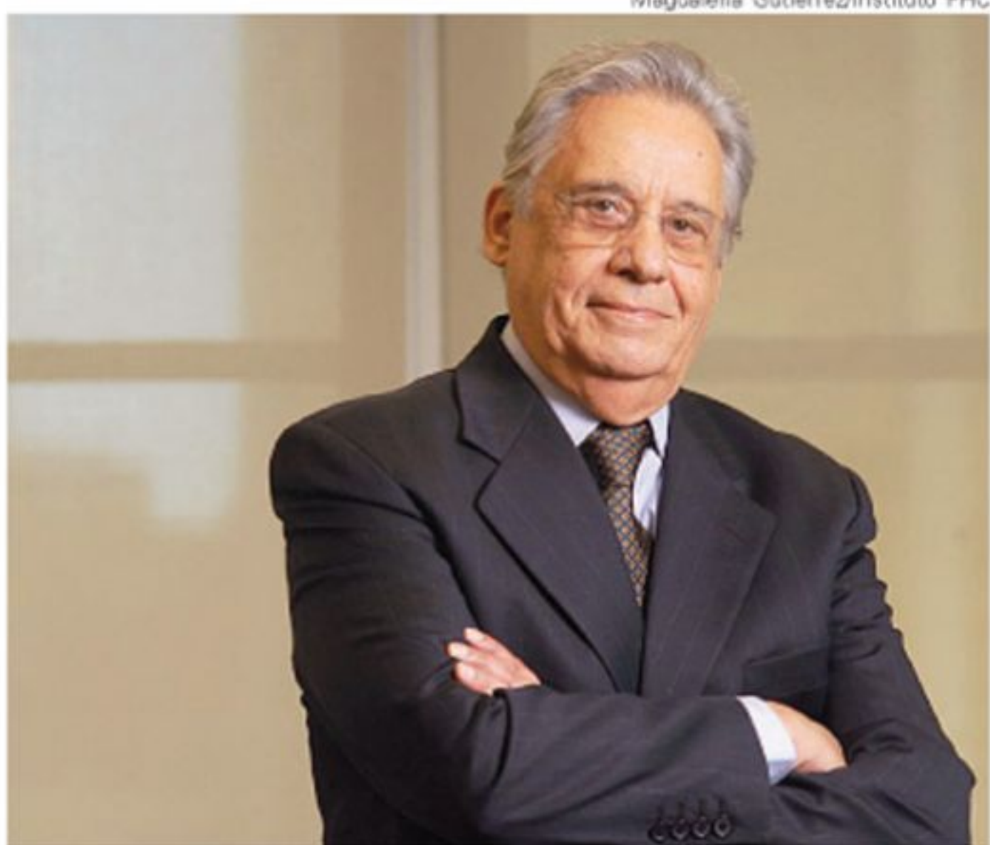
FHC e Aécio Neves, caciques tucanos, derrapam e partido apela na televisão