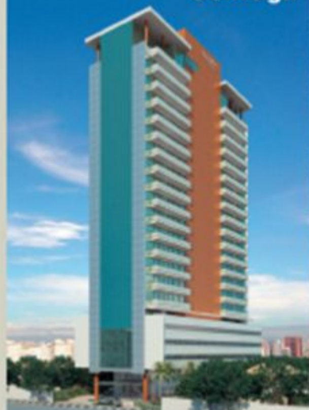
Perspectiva da fachada com faixas para Av. Ana Costa

FUNDAÇÕES CONCLUÍDAS - ENTREGA EM 16 MESES