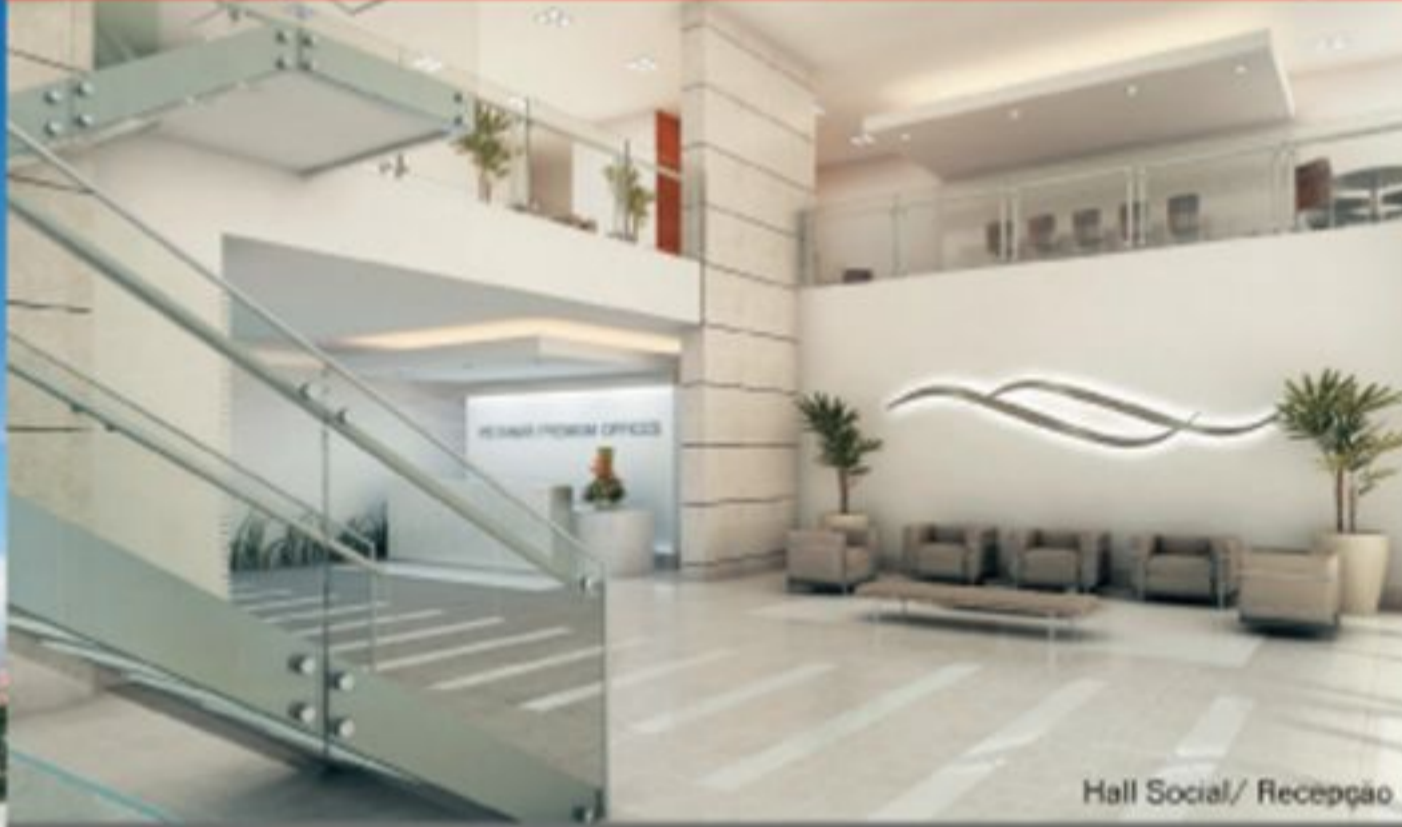
Hall Social/ Recepção