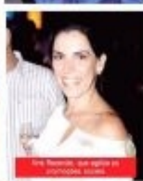
De 2008, que casou-se com o marido, ela é feliz