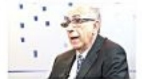
Governador Alckmin durante o lançamento do orçamento.

Quando da elaboração das metas para o orçamento e o crescimento das despesas com a falta de pagamento de impostos, o governador Alckmin afirmou que a meta é aumentar a eficiência e equilibrar o orçamento.