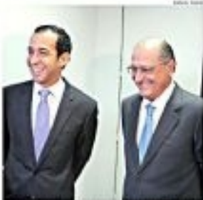
Fuad Alakbarian, ministro do Turismo, em reunião com o governador Alckmin para discutir o pacote de investimentos no turismo.

O pacote prevê a liberação de R$ 97,2 milhões para investimentos em infraestrutura turística, incluindo a construção de hotéis, a melhoria de aeroportos e a criação de novos pontos turísticos.