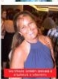
De 2008, quando casou-se com o marido, ela é feliz