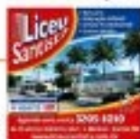
Apresentação em CD R$95 - R$140 40 minutos de música em CD www.linceusampaio.com.br

Beats 4 Ever - Apoiada aos 5 maior Banda Beats do Brasil, retorna a Sento para única apresentação. O show não acabou e Beats 4 Ever prova isso, num show de 100 minutos que come-