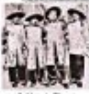
Folclore do Bloco Choveras do Maratão