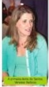
A professora da Santa Maria de Fátima