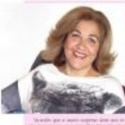
JULIANNE MOORE A Vida em Espera

"Nada quanto a isso aqui" tem sido um sucesso. O filme é muito bom e merece o prêmio. Mas não basta apenas ter um filme bom. Ele precisa ter um nome conhecido. E isso ele conseguiu com o filme "Nada quanto a isso aqui".