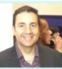
MATT DAMON O Jogo da Verdade

"Nada quanto a isso aqui" tem sido um sucesso. O filme é muito bom e merece o prêmio. Mas não basta apenas ter um filme bom. Ele precisa ter um nome conhecido. E isso ele conseguiu com o filme "Nada quanto a isso aqui".