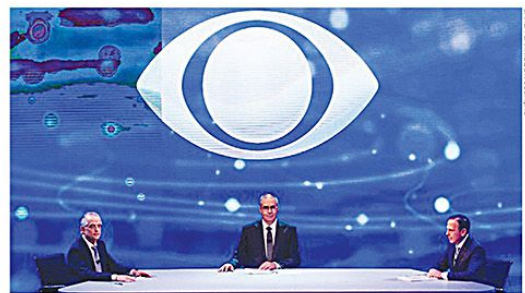
Os dois primeiros debates foram bastante acalorados; acima, o encontro na TV Bandeirantes

Os dois candidatos também prometem investimentos em áreas consideradas essenciais pelos eleitores, como saúde, educação, segurança e geração de empregos.