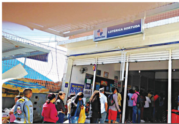
FILAS PARA PAGAR CONTAS - Lotéricos fazem o trabalho de banco, enquanto a Caixa fica com o filé mignon dos jogos

Com o novo portal os usuários já podem jogar na Mega Sena, Lotofácil, Quina, Lotomania, Timemania, Du-