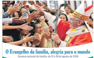
O Evangelho da família, alegria para o mundo Semana nacional da família, de 12 a 18 de agosto de 2018

De 12 a 18 de agosto, a Igreja, em todo o Brasil, celebra a Semana Nacional da Família (que teve início em 1973 na Diocese de Santos, com as Equipes de Nossa Senhora). Cada ano, a Coordenação Nacional destaca um tema que deverá ser objeto de atenção e reflexão em nossas comunidades. Este ano, será comemorado com o tema: "O Evangelho da família, alegria para o mundo".