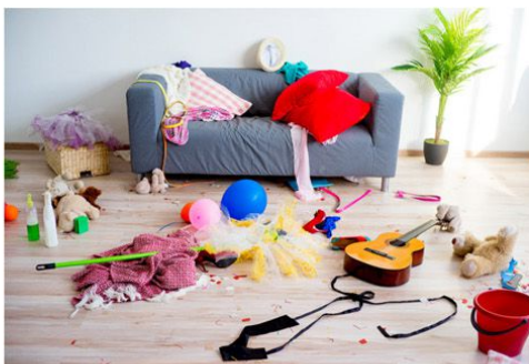
Erena Nicheitnovavrae Stock

Para o armazenamento desses objetos, a sugestão é procurar um local adequado. "Nesses casos, boxes, estilo guarda-volumes, podem ser a solução. Você mantém o seu objeto, mas sem ocupar espaço na casa", comenta o proprietário da Espaço A+, Almir Parigot.