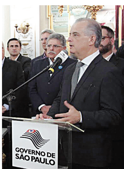
Governador Marcio França anunciou que ligação entre Santos e Guarujá será feita pela Ecovias