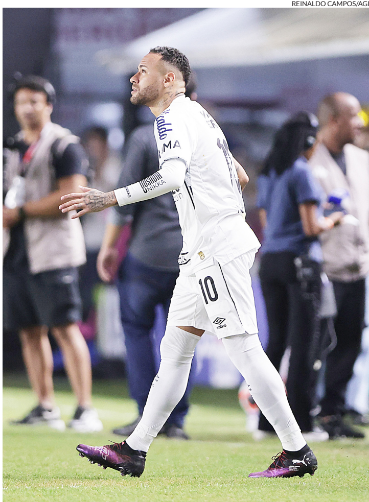
Neymar entrou em campo após o intervalo da partida

Wallison foi expulso aos 25 do segundo tempo. Peixe com um a mais. Jogo muito movimentado. Os dois times estavam perigosos em campo. Neymar sentiu um pouco de cansaço, mas continuou dando bons passes. O camisa 10 puxou a marcação e Guilherme assustou o adversário. ●