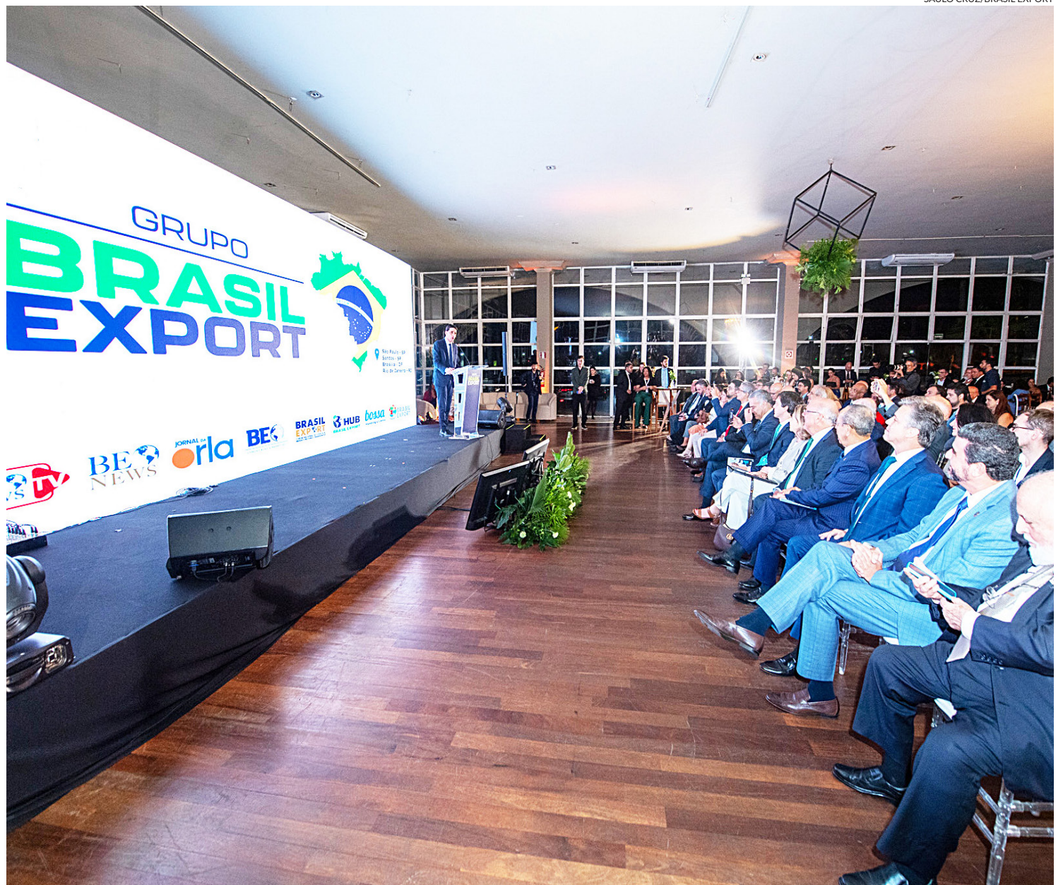
Primeiro fórum do ano acontecerá ainda no mês de fevereiro, no Recife, terra do ministro de Portos e Aeroportos Silvio Costa Filho

“Nós trouxemos o Santos Export quase abrindo o nosso calendário por ser o principal fórum da temporada depois do Fórum Nacional, pela tradição. Foi onde tudo começou”, afirmou o CEO.