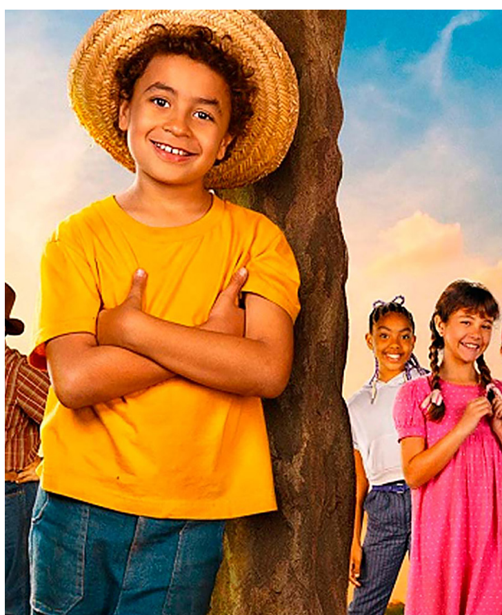
Chico Bento é outra produção nacional com preços acessíveis