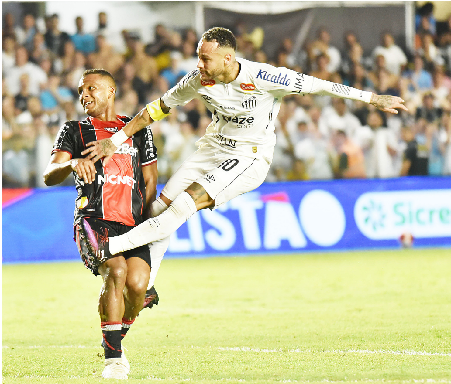
Camisa 10 do Peixe deu bons chutes a gol, exigindo defesas importantes do goleiro do Botafogo

Neymar iniciou trabalho de aquecimento ainda na primeira etapa. O Botafogo foi muito perigoso no final da primeira etapa.