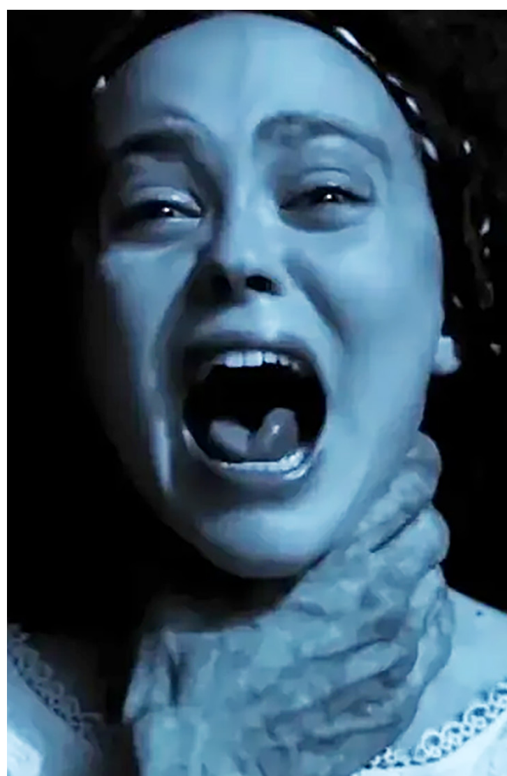
Terror moderno com inspiração clássica, Nosferatu é opção

raviosa’ (inspirado nas criações de Maurício de Sousa), ‘Capitão América: Admirável Mundo Novo’, ‘Dragon Ball Daima’, ‘Blindado’ e ‘Acompanhante Perfeita’.