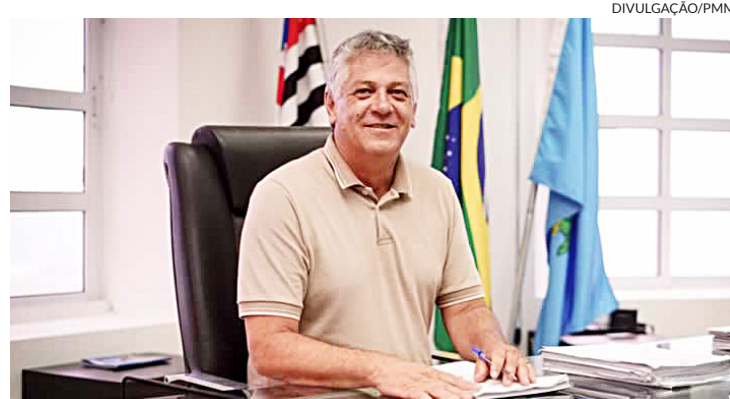
Apesar do mar revolto, prefeito mantém otimismo

Na carona dos discursos dos novos presidentes do Senado e da Câmara federal, o prefeito de Mongaguá demonstra otimismo e fala em desenvolver seu traba-