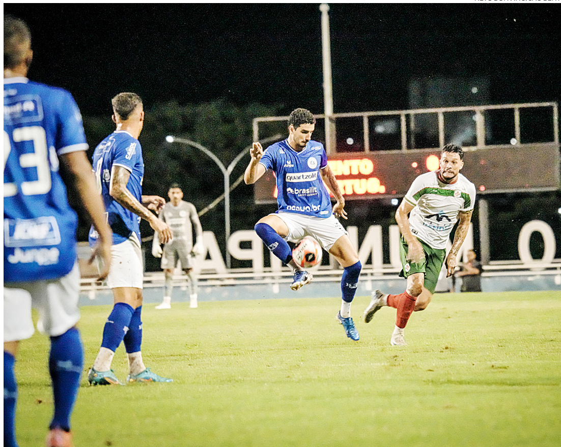
A Portuguesa Santista criou pouco e se defendeu muito, deixando a pressão na mão do São Bento

fronto direto pela salvação continuou. A Briosa se mostrou melhor nos primeiros momentos, pressionando e buscando jogar mais no campo do São Bento. Aos 10 minutos, Vieira, atacante da Portuguesa teve a camisa puxada dentro da grande área. Pênalti que o próprio camisa 9 bateu mas o goleiro goleiro Guilherme Neto acertou o canto e defendeu.