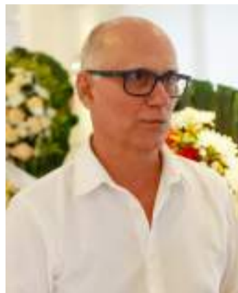
Papa: "Sempre foi uma referência".