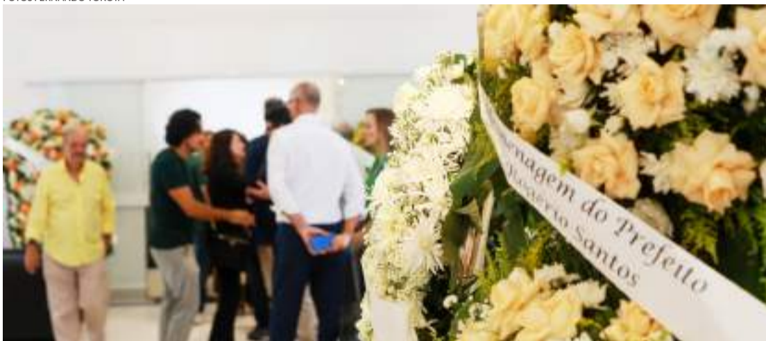
Dezenas de pessoas acompanharam o velório; Gil deixa três filhos e três netos