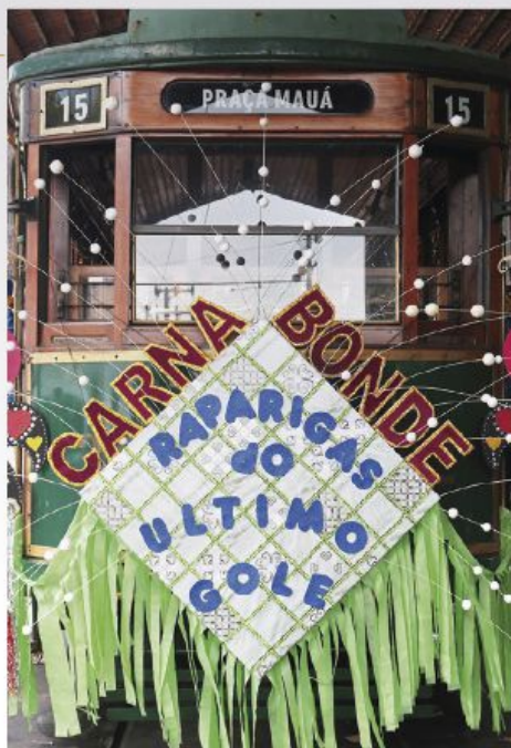
ISABELA CARVALHO | PMS