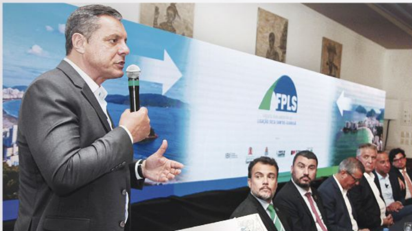
O túnel submerso entre Santos e Guarujá terá 860m de extensão e custo estimado em R$ 5 bilhões

O deputado ainda destacou a participação do ministro de Portos e Aeroportos, Márcio França, e do governador do Estado, Tarcísio de Freitas, na articulação da obra, que será realizada em parceria entre as esferas Fe-