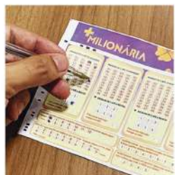
BÁRBARA CAMARGO / JORNAL DA ORLA

As apostas começam já no mês de maio e o primeiro sorteio está previsto para o dia 28. A aposta mínima vai custar R$ 6,00 e o apostador deve marcar seis números de 1 a 50 e escolher 2 trevos da sorte, que levam os números de um a seis.