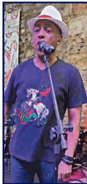
O cantor IVO PRADO anima e agita a pista