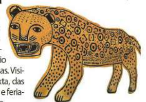
BEATRIZ SAYURI/ DIVULGAÇÃO

Iniciativa do Sesc traz a Santos a mostra "Ocupação: Denilson Baniwa", com obras em lambe-lambe e vídeo-projeções do artista natural do Rio Negro, no interior do Amazonas. Visitação: até 30/4, de terça a sexta, das 10h às 21h30, fins de semana e feriados, das 10h às 18h30. Gratuito.