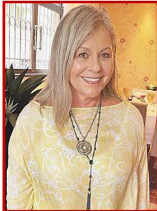
Sem dúvida, uma perfeita anfitriã, reuniu algumas amigas para um brinde à vida